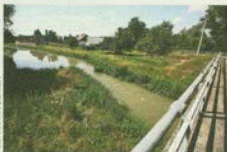
Po rokoch: Jazierko už neexistuje, zostal len opustený bazén.