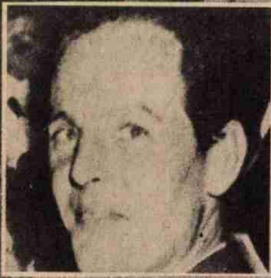
Maclean temetése Moszkvában

ségre titkárként. (Itt sokat találkozhat egykori diák-társával, a Times tudósítójaként akkor már a szovjet hírszerzésnek dolgozó Kim Philbyvel.)