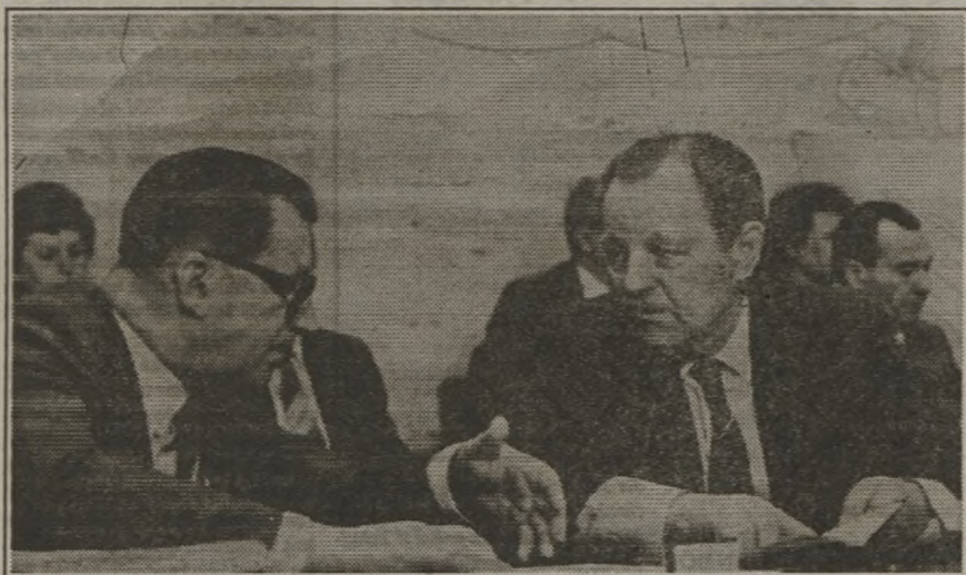
To je jednoduché! Slušovice nám šlapou, teď zasáhne Prognostický ústav a můžeme spustit akci "listopad".