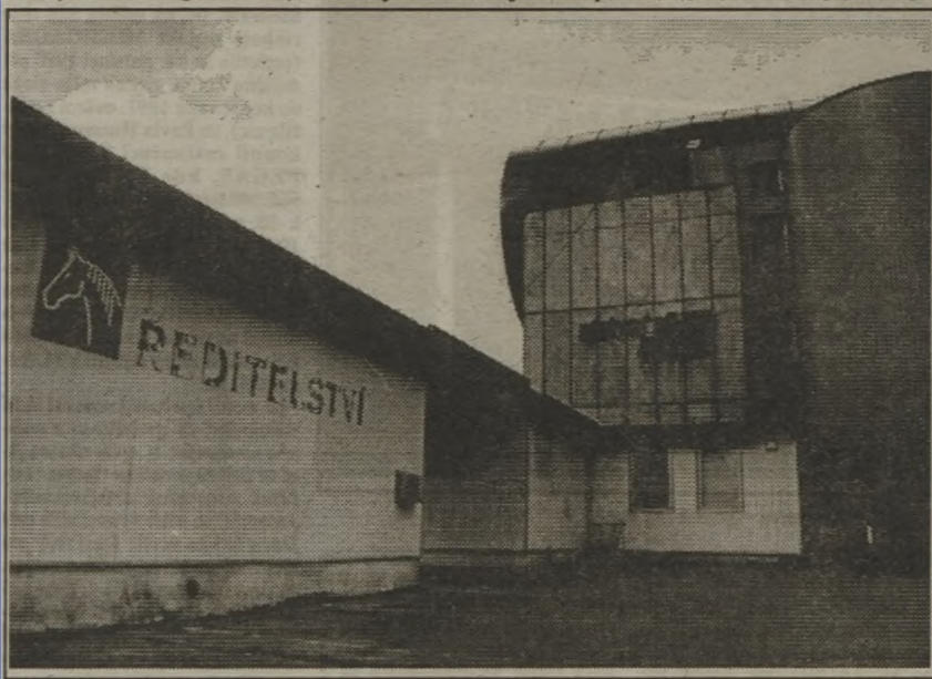
Ředitelství dostihové dráhy, výstavní síň Slušovic.

(A opět: všimněte si názvu společnosti. O mnohých jsme v předešlých částech našeho seriálu už mnohokrát hovořili. V různých, ne zrovna příjemných okolnostech. A zdá se,