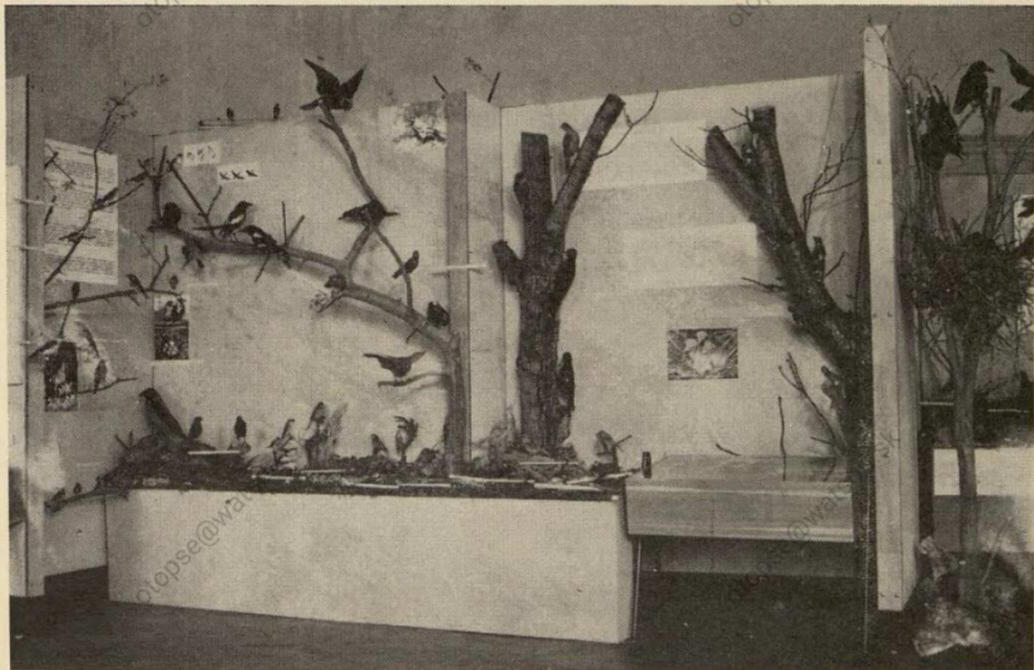
Ukážka z inštalovania spevavcov.

Možno povedať, že brožúrka neposlúži len v čase výstavy, ale stáva sa trvalou príručkou pre všetkých záujemcov o prírodu — učiteľov biológie, ochrancov prírody atď.