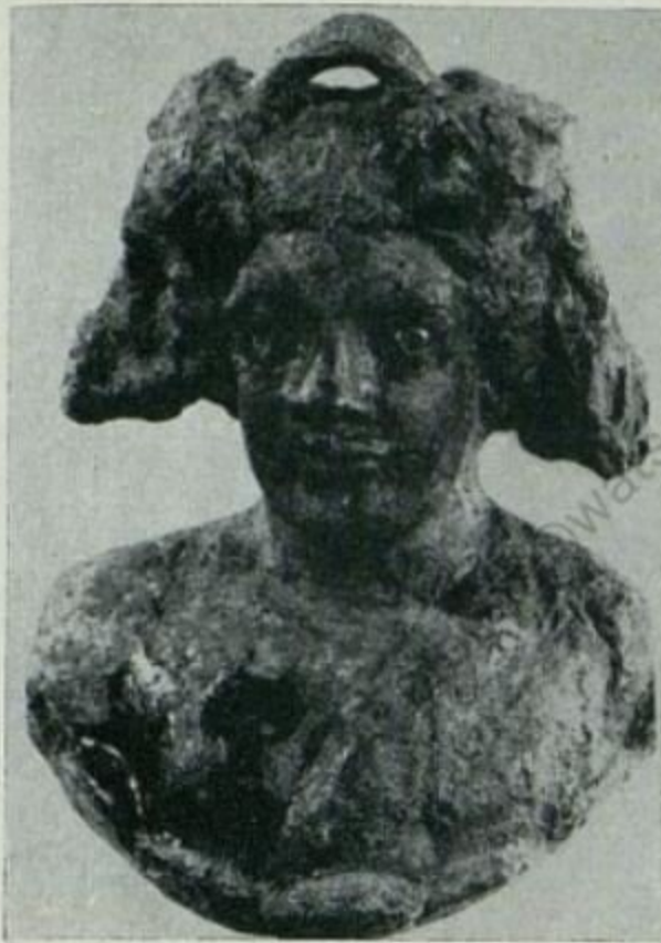
82 PM v Komárne – poprsie Dionýza