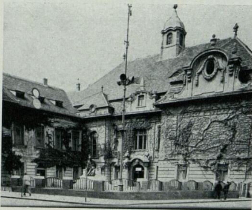
81 Budova Podunajského múzea v Komárne.

Drevená budova v parku (dočasný útulok múzea) pustla a už spomínaný Krajinský úrad vyslal znova komisiu do