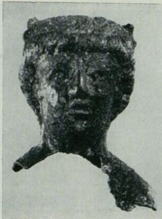
83 PM v Komárne – zlomok rímskej bronzovej sošky dieťaťa