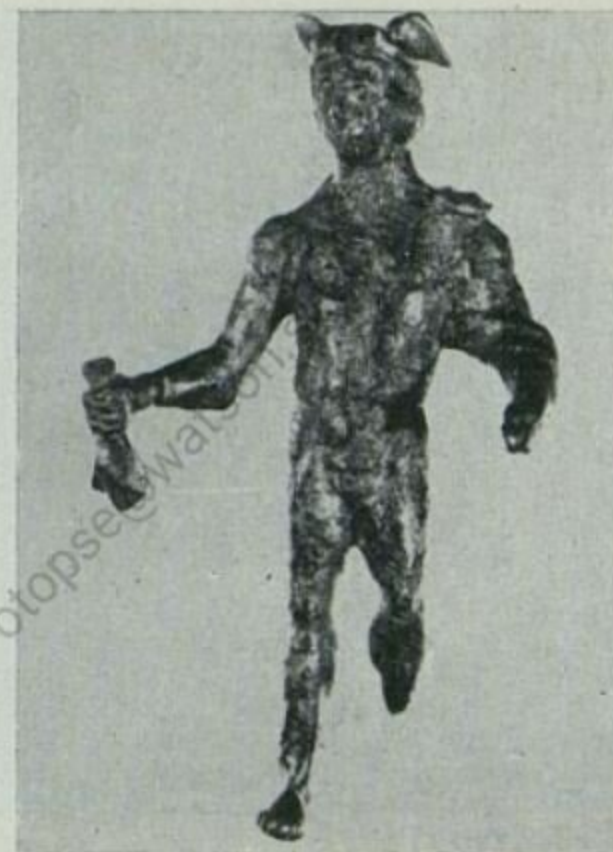
84 PM v Komárne – soška Merkúra