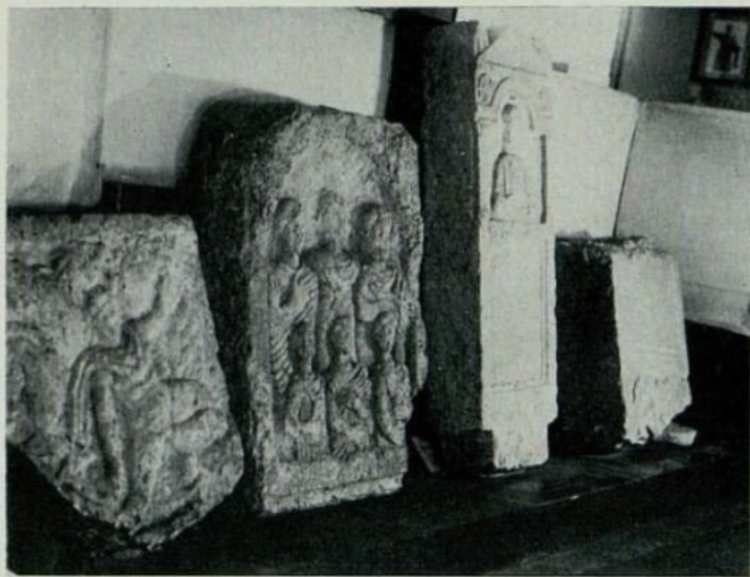
86–87 PM v Komárne – náhrobné kamene.

Tento rozlet v práci múzea bol zastavený druhou svetovou vojnou. V budove bola znovu umiestená nemocnica, muzeálne predmety z miestností boli umiestené vo zvyšných miestnostiach a pred blížiacim sa frontom uskladnené v pivnici kláštora, z ktorej bol neskoršie spravený verejný protiletický kryt. Debny boli vyhádzané von, a tak sa mnohé pamiatky zničili a stratili. Budova múzea počas prechodu frontu i po jeho prechode zostala opustená.