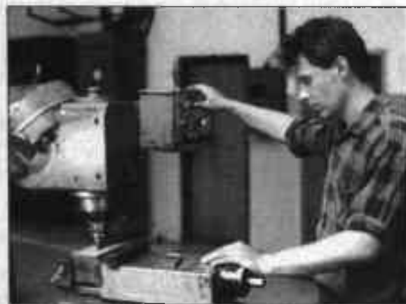
Presnosť a precíznosť opracovania výrobkov je vo VUNAR-e alfou a omegou. V jej mene dbajú na pravidelnú údržbu strojov.

nové slovenské riadiace systémy. Tým sa z mechanickej desaťročnej mašiny stane za dva mesiace nový stroj, o niekoľko generácií lepší. Je to riešenie ako stvožené pre slovenský priemysel,“ vysvetľuje výkonný riaditeľ. Keďže však Slováci sú národ vynachádzavý, zlú finančnú situáciu strojárskych podnikov začali chytrí ľudia zneužívať. „Viete, ako sa to robí? V exekúcii sa odkupujú staré stroje za zlomok ceny, vyvezú sa do zahraničia, urobí sa na nich retrofit a potom sa vyvážajú do krajín bývalého východného bloku a inde. Napríklad do Českej republiky dovezli minulé