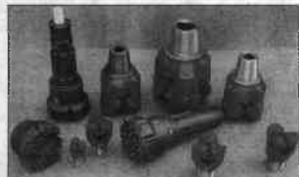
Vrtné súpravy sú základom výrobného programu VUNAR-u