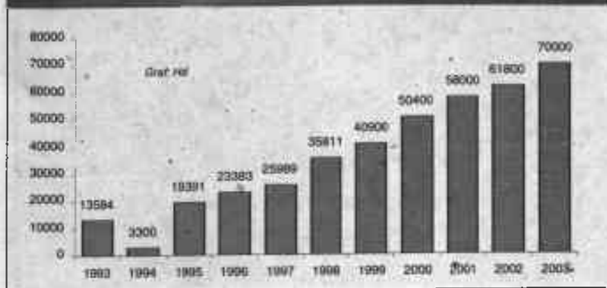
Pridaná hodnota v rokoch 1993 - 2003 (v tis. Sk)

„Neexistujú žiadne dlhodobé zmluvy, každá dodávka sa uskutočňuje na základe osobitnej objednávky. Zjednodušene môžeme povedať, že kvalitou súčasnej dodávky si zabezpečujeme ďalšiu objednávku. Pred štyrmi rokmi, keď sme začali, bolo nás asi tridsať tovární zo Slovenska – dodávateľov pre Volkswagen. Dnes nás možno spočítať na prstoch jednej ruky,“ konštatuje riaditeľ. Pritom dominujú iba dve veci: včasnosť a kvalita. Zdlhavé reklamácie, ako ich poznáme z domácich dodávok, neexistujú. „Keď je niečo zlé, zistí sa to až vo Wolfsburgu. Dodávateľ musí na vlastné náklady chybu odstrániť. Neopraviteľné poruchy sa odstraňujú tak, že dodávateľ musí ísť po výrobok, znovu ho na vlastné náklady vyrobiť a dopraviť na miesto určenia. Tým však vo Volkswagen skončil. To si VUNAR, ktorého dodávky pre nemecké automobilky (okrem VW, na základe jeho referencií ešte Audi) tvoria výše 50 % produkcie, nemôže dovoliť. Strojárka firma dnes na Slovensku ťažko hľadá pravidelný odbyt i partnera, ktorý bez príchodu za dodaný tovar platí. Preto si chcú nemeckého partnera udržať. Krokom k väčšej istote je zavá-