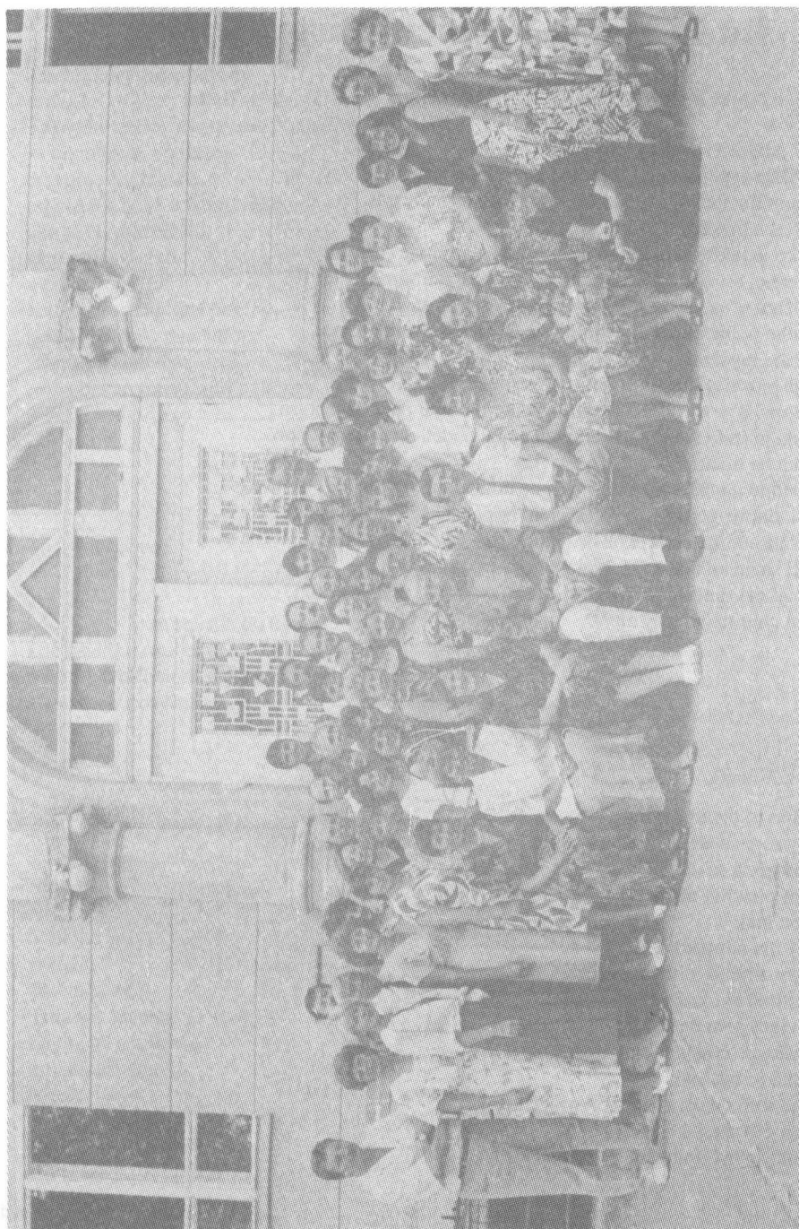
Pedagogický zbor Gynázia s vyučovacím jazykom slovenským a maďarským v Nových Zámkoch v roku 150. výročia