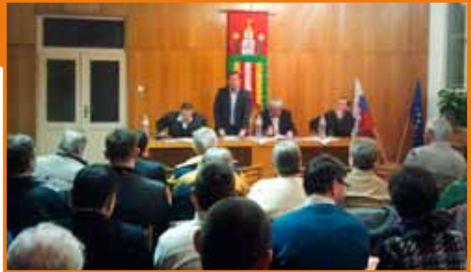
Felsőszeli lakosai is meghallgatták Nagy József minisztert, valamint Érsek és Csicsai államtitkárokat.