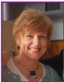
Vážení rodičia, žiaci 9. ročníkov základných škôl!

Absolventi Strednej odbornej školy obchodu a služieb v Galante sa v rámci Trnavského samosprávneho kraja v uplatňovaní na trhu práce umiestňujú podľa prieskumu už na 4. mieste!