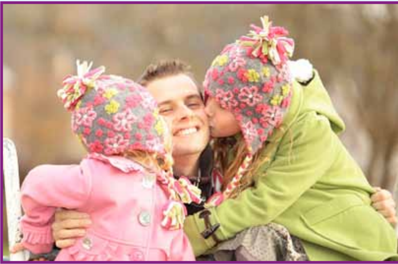
sympatický politológ si veľmi váži najmä spoločné voľné chvíle so svojimi najbližšími

som sa stal Vedúcim vzdelávania na Inštitúte vzdelávania odborov Slovenskej republiky za Fakultu politických vied a medzinárodných vzťahov Univerzity Mateja Bela v Banskej Bystrici. V rámci tejto pozície som mal možnosť z blízka pozorovať aj vznik samotnej Vysokej školy v Sládkovičove, ktorá sa formovala ako jedna z prvých súkromných škôl so zaujímavou perspektívou.