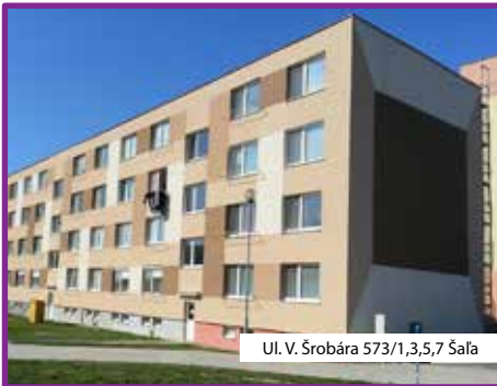
Ul. V. Šrobára 573/1,3,5,7 Šaľa

v správe SBD Šaľa. Ako by ste hodnotili svoju prácu vy, čo to pre Vás znamenalo, že ste dostali takúto dôveru, pretože sa jedná o veľký objem prác – a aká je spätná väzba od obyvateľov činžiakov?