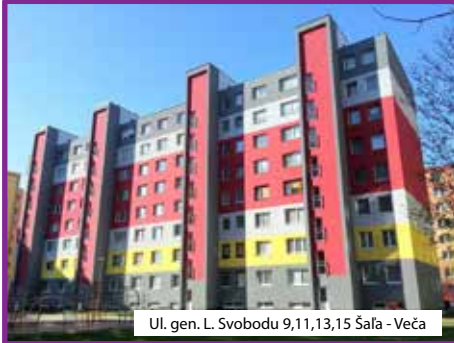
Ul. gen. L. Svobodu 9,11,13,15 Šaľa - Veča