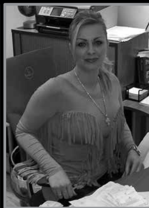
manželia Magdalikovi podnikajú spoločne

rozpracovaný harmonogram, aby som splnil požadované termíny, ktoré mám zmluvne stanovené s investormi. Máme momentálne 23 zamestnancov a 8 živnostníkov, s ktorými spolupracujem. Zaoberáme sa hlavne zatepovaním objektov (fasády, strešné plášte), klampiarske práce, generálne