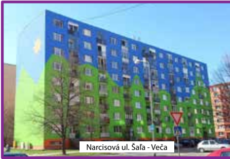
Narcisová ul. Šaľa - Veča