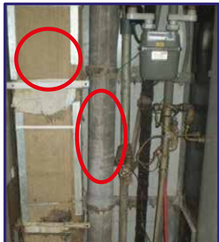
„AZC“ odpadová rúra v bytovom jadre

Je dokázané, že azbest svojimi voľne poletujúcimi respirabilnými vláknami mikroskopických rozmerov (vlákna sú voľným okom neviditeľné) môže pri vdychovaní spôsobiť rakovinu pľúc