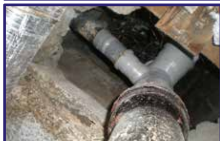
„AZC“ kanalizačné potrubie