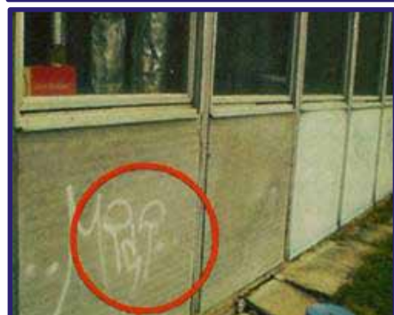
Azbest v bočnom obložení