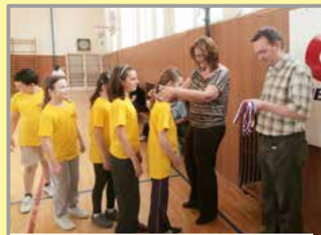
Zlaté medaily získali žiaci ZŠ J. Fándlyho v Sereďi

A potom už nasledovalo veľké finále, ktoré sľubovalo od začiatku veľkú