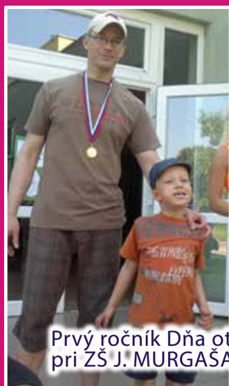
Prvý ročník Dňa otcov v MŠ pri ZŠ J. MURGAŠA v Šali sa vydaril, str. 17.