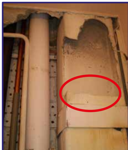
Azbestový monolit vzduchotechniky