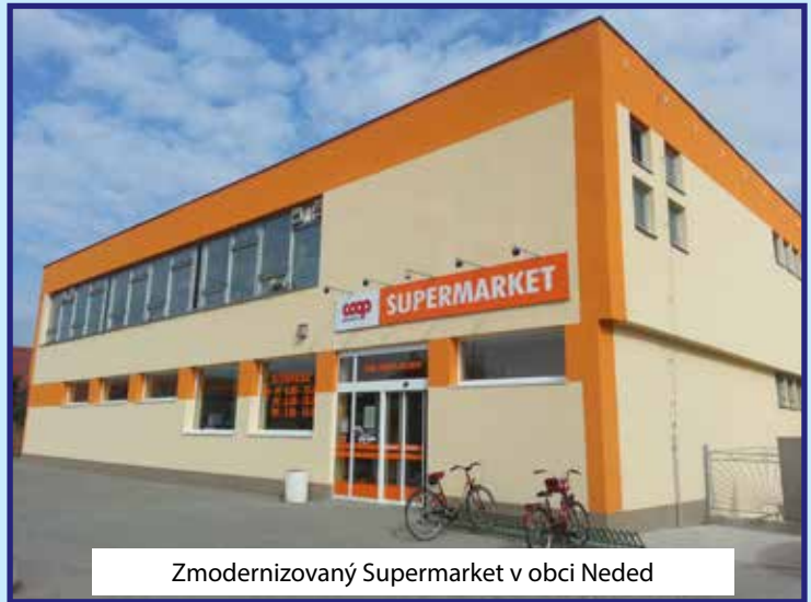
Zmodernizovaný Supermarket v obci Neded