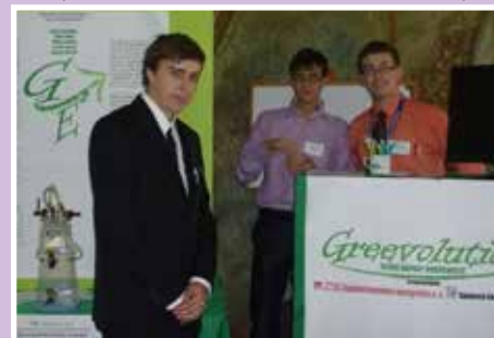
Chlapci z III.E pri prezentácii svojho výskumu v rámci výzvy - Najlepší nápad v Bratislave

Pre žiakov končiacich trojročné štúdiá máme pripravené pokračovanie v dvojročnom nadstavbovom štúdiu príslušného zamerania a končiace maturitnou skúškou.