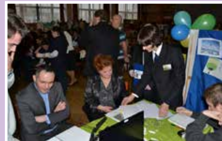
Takto to vyzera pri prezentáciách cvičných firiem v KS v Šali - 5.ročník Veltru cvičných firiem - 5.2.2014