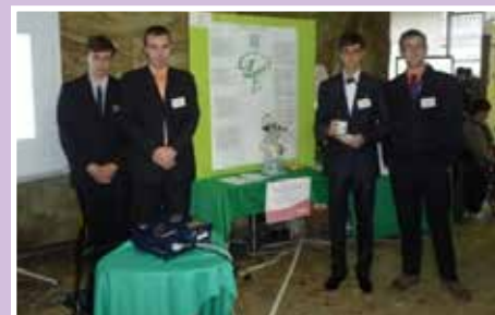
Chlapci z III.E pri prezentácii svojho výskumu v rámci výzvy - Najlepší nápad v Bratislave

Svet hľadá ľudí, ktorí vedia niečo urobiť, nie ľudí, ktorí vedia vysvetliť, prečo niečo neurobili. H. Rowlandová