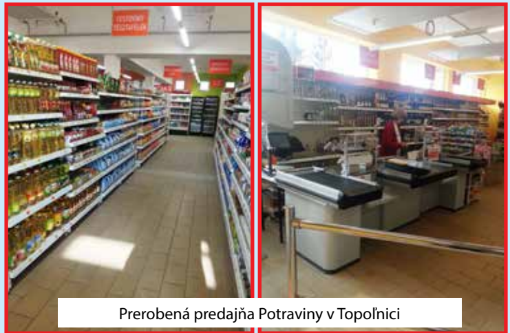
Prerobená predajňa Potraviny v Topolnici