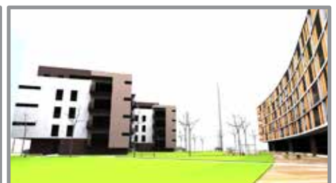
obrázky/ vizualizácia: Ing. Arch. Imrich Pleidel