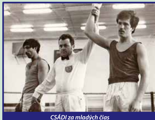
CSADI za mladých čias