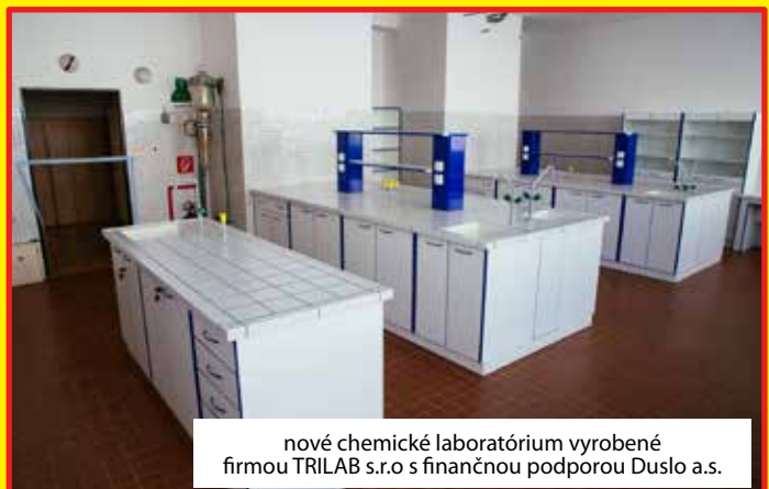
nové chemické laboratórium vyrobené firmou TRILAB s.r.o. s finančnou podporou Duslo a.s.