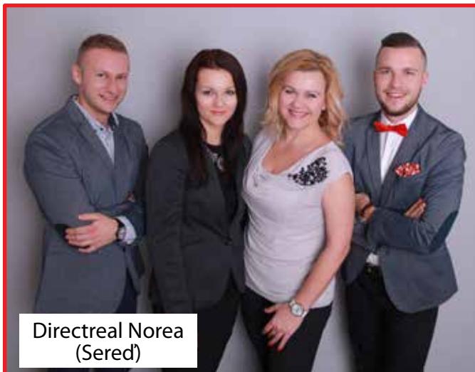
Directreal Norea (Sered)