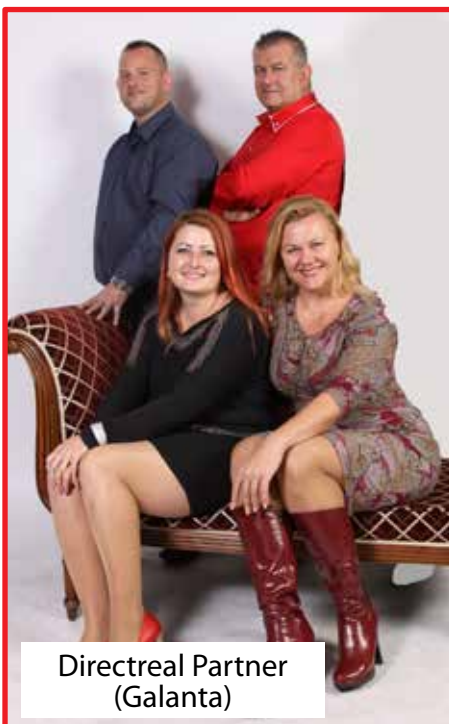
Directreal Partner (Galanta)