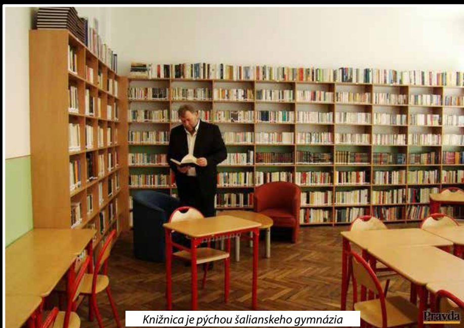
Knižnica je pýchou šalienského gymnázia

Vnútroštruktúrna kvalita školy je tvorená z 23 plne kvalifikovaných pedagógov, ich vekový priemer je cca 40 rokov. Aj vzhľadom na zmenu plánu výkonov (zrušenie kontinuity 8-ročného gymnázia) škola prešla v priebehu posledných rokov mnohými personálnymi zmenami, hlavne v kvalitatívnej oblasti, čím sme chceli dosiahnuť zvýšenie kvality samotného vzdelávania vo všetkých fázach vzdelávania. V rámci objektivity treba dodať, že odišli aj kolegovia, ktorí odchádzali do dôchodku či na ZŠ (odkiaľ prešli do vzdelávacieho procesu pre 8-ročné gymnázium). Aj touto cestou sa im chceme poďakovať za ich odbor-