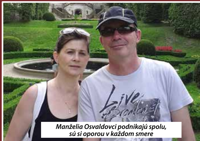
Manželia Oswaldovci podnikajú spolu, sú si oporou v každom smere

„Budúcnosť obuvníckej profesie v dohľadnej dobe nevidím optimisticky z dôvodu, že výrobcovia obuvi u nás sú stále konfrontovaní s cenou dovážanej menej kvalitnej obuvi. Takže výrobca kvalitnej obuvi má veľké problémy s predajnosťou svojich výrobkov. V podstate aj keby si chcel zákazník zaplatiť viacej za kvalitnú obuv, ťažko sa mu vyberá, nakoľko v súčasnej dobe neexistuje osвета v oblasti tejto profesie a zákazníkovi nemá kto odborne poradiť až na výnimky... Zo skúseností viem, že zákazková výroba obuvi nemá v súčasnej dobe až takú perspektívu, dalo by sa povedať, že keby som sa aj dal na zákazkovú výrobu obuvi,