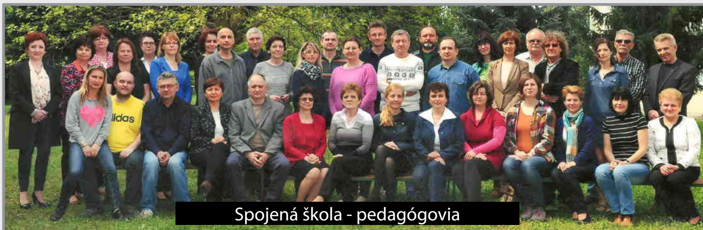
Spojená škola - pedagógovia