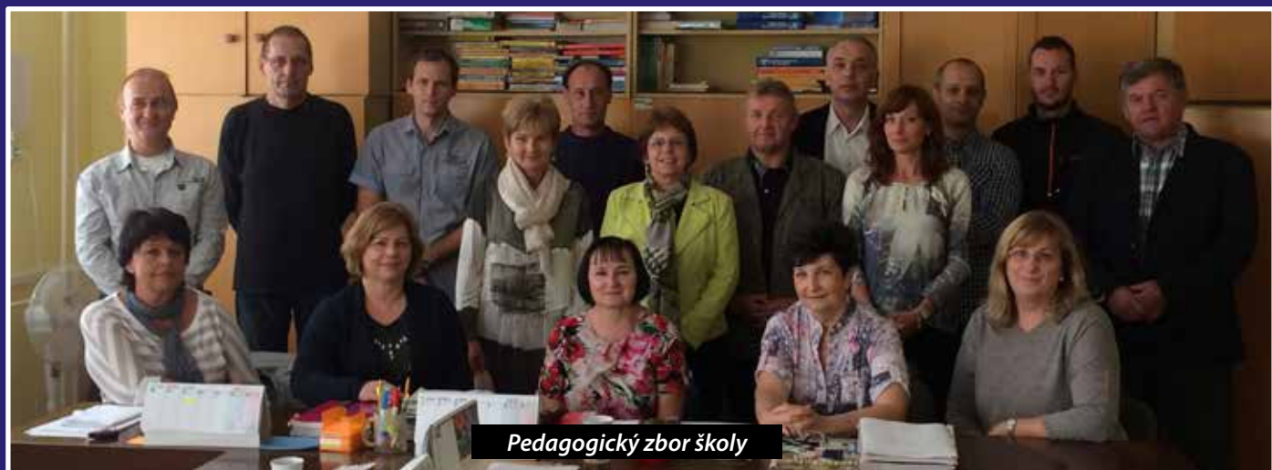
Pedagogický zbor školy

adení . Už počas štúdia sa môžu zúčastňovať odborných stáží v poľnohospodárskych subjektoch, s ktorými má naša škola rámcovú dohodu o spolupráci - DAN-FARM s.r.o., Agroservis s.r.o., Biolife s.r.o., Agrovok s.r.o. a s mnohými súkromne hospodáriacimi roľníkmi. Aj