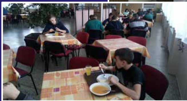
Kuchárky sa snažia chutne navariť...

Ani v tomto školskom roku nechceme zanedbať prípravu žiakov na odborné súťaže – Zenit v strojárstve, Súťaž zručnosti, Mladý zvärač, Mladý poľnohospodár. Nemenej zaujímavé