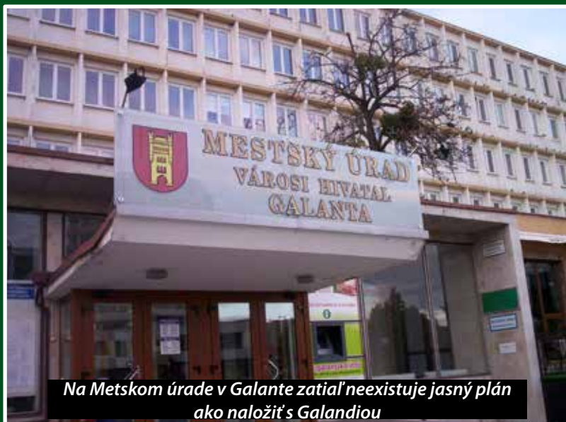
Na Mestskom úrade v Galante zatiaľ neexistuje jasný plán ako naložiť s Galandiou