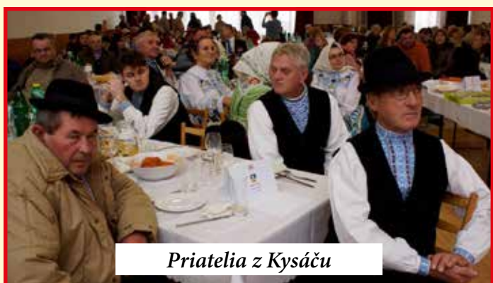
Priatelia z Kysáču