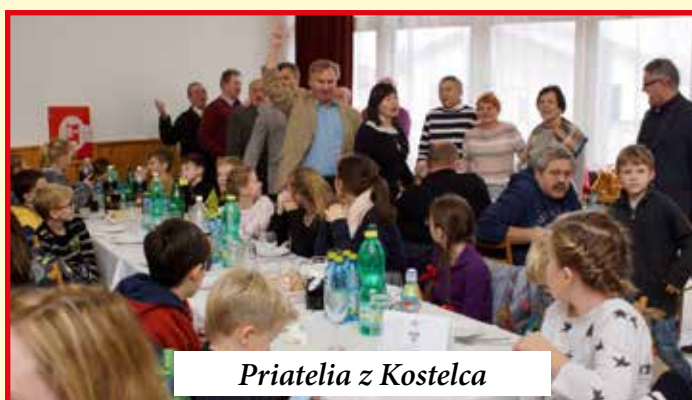
Priatelia z Kostelca