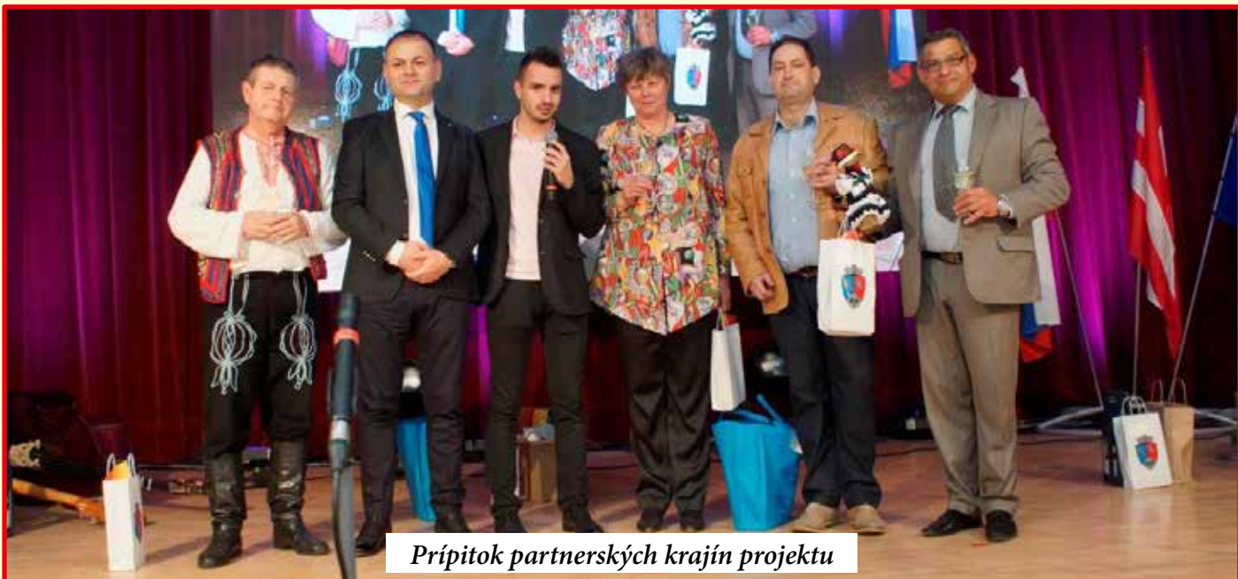
Prípitok partnerských krajín projektu