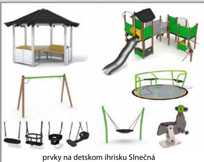
prvky na detskom ihrisku Slnecná

Ďalšia plocha, na ktorej sa budú môcť vyšantiť rôzne vekové kategórie, je na Slnecnej ulici . Tunajšia asfaltová plocha bude ponúkať okrem lezeckej zostavy aj exteriérové fitness zariadenia. Každý, kto si bude chcieť zašportovať, bude môcť využiť exteriérové bradlá, stepper a ďalšie prvky. Prostredie tu bude atraktívnejšie aj vďaka