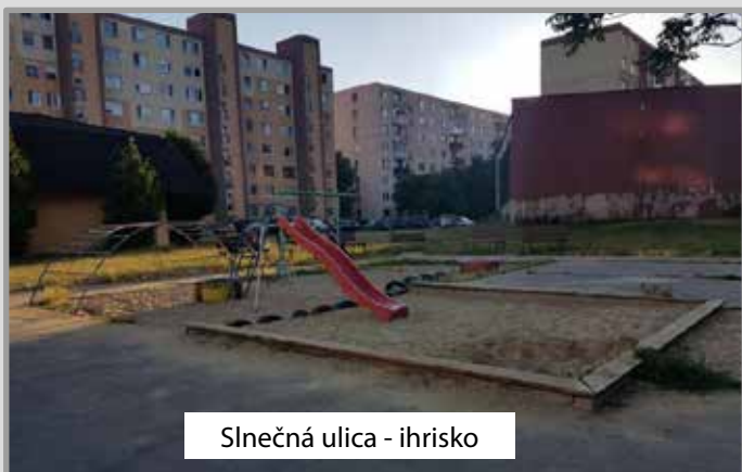
Slnecná ulica - ihrisko