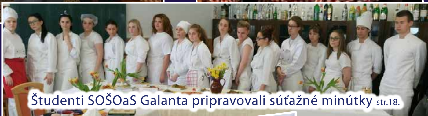
Študenti SOŠOaS Galanta pripravovali súťažné minútky str.18.