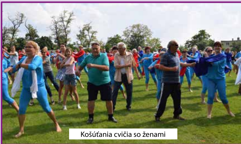
Košúťania cvičia so ženami

Podakovanie za toto krásne podujatie patrí i starostke obce Košúty, pre ktorú je šport srdcovou záležitosťou. Svedčí o tom i skutočnosť, že v klubovni futbalového štadióna OCF Košúty na čestnom mieste visí dres s nápisom „Starostka“. Košútsky futbalový štadión bol vďaka nej už po tretíkrát miestom spoloč-