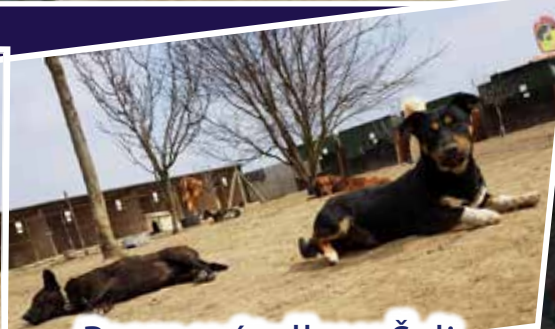
Psom v útulku v Šali môžete pomôcť aj vy str.16.

ŠAĽA: P. Pázmaňa 60 tel.: 78 99 155 www.zalozna.sk