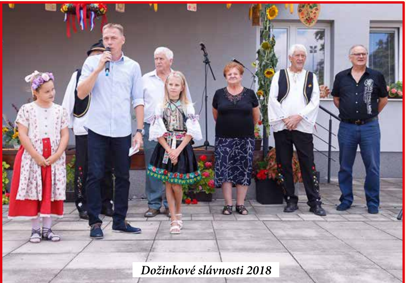
Dožinkové slávnosti 2018