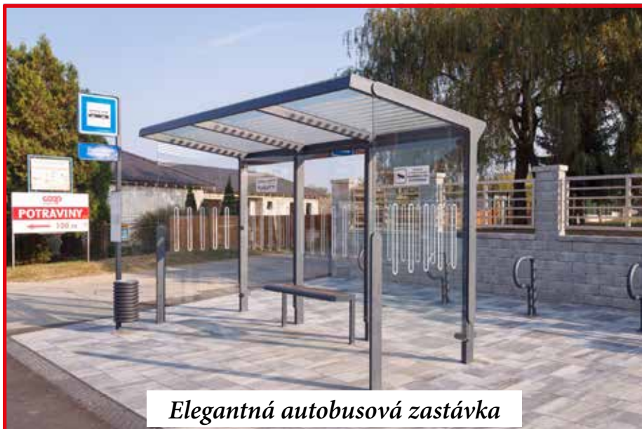
Elegantná autobusová zastávka