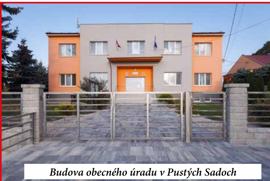
Budova obecného úradu v Pustých Sadoch

čujeme v tradícii. Zakomponovali sme však do nášho kultúrno – spoločenského kalendára aj nové akcie. Viem, že ľudia prichádzajú domov z práce unavení a chcú mať pokoj, ale aj tak sa ich pokúšame vylákať z pohodlia ich domova, aby sme v nich podporili entuziazmus a vôľu pre veci verejné.“ Už tradičným sa v Pustých Sadoch stal júnový Družobný deň obcí. Za veľkej slávy sa stretnú predstavitelia troch blízkych dedín – Pusté Sady, Zemianske Sady a Šalgočka. K svojim susedom prídu v slávnostnom sprievode, pričom dominujú ich typické farby. Obyvatelia Pustých Sádov sa oblečú do červeného, je to ich farba, pretože boli dedinou kráľovských trubačov. Potom sa začína zábava ale aj súťaženie. Sily sa však merajú v zábavnom a humornom duchu, ide napríklad o súťaž v preťahovaní lanom. Svoju šikovnosť v tento deň predvedú miestne spevokoly či tanečné súbory. Celá dedina je na nohách, na zaujímavom podujatí sa stretnú stovky ľudí, je to viac ako obyvateľov dediny dokopy. Každý sa zabáva, nikto nechce v tento deň sedieť doma. Leto potom pokračuje dožinkovými slávnosťami, na