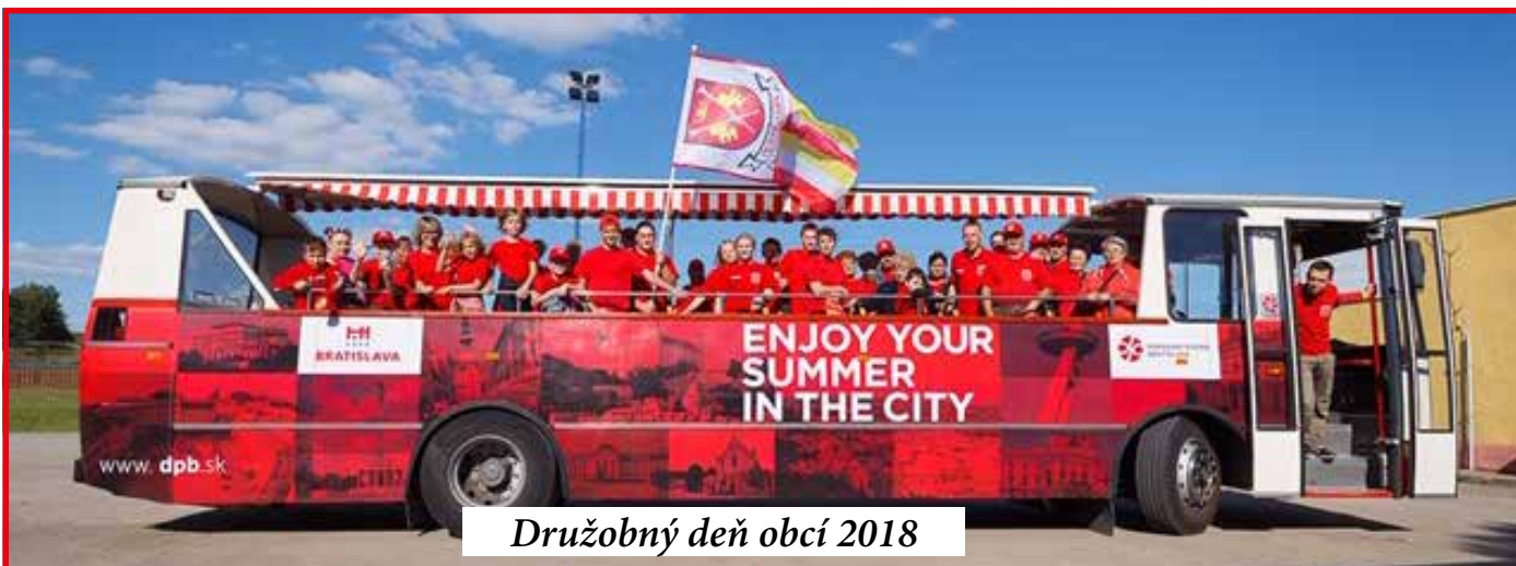
Družobný deň obcí 2018

spoločenský kalendár. Do komunitného spôsobu života sa zapájajú deti aj seniori, muži či ženy. „Nedávno pri základnej škole vznikol turistický krúžok. Naše šikovné seniorky ale aj ženy v strednom veku sa pravidelne stretávajú, aby spolu tvorili rôzne ozdobné dekoratívne predmety, hovoria si preto Motalinky. Nezabúdame na obecnú zabíjačku, obecný