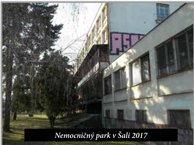
Nemocničný park v Šali 2017