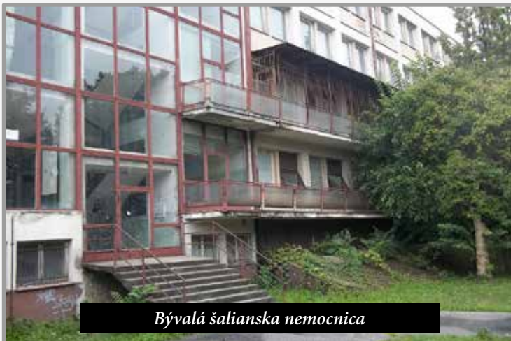
Bývalá šalienská nemocnica