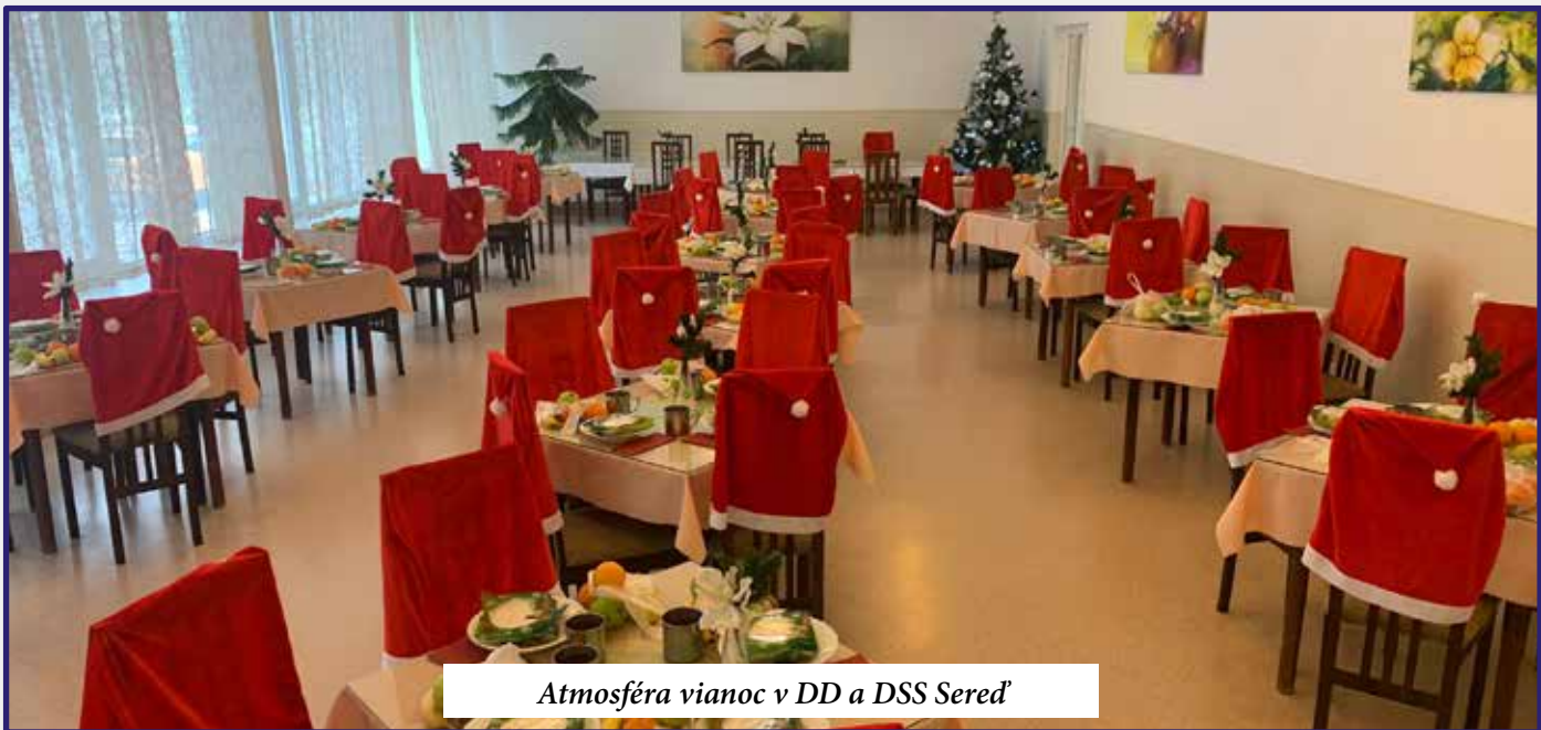
Atmosféra vianoc v DD a DSS Sereď