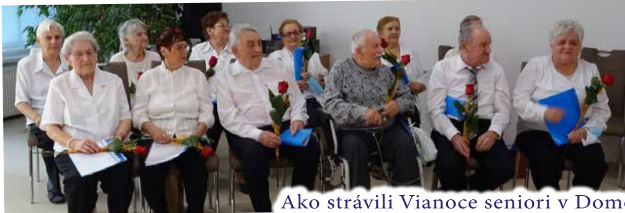
Ako strávili Vianoce seniori v Domove dôchodcov Patria v Galante? /str.13.

Ročník XXV. • DECEMBER 2021 • časopis pre občanov okresov Galanta a Šaľa