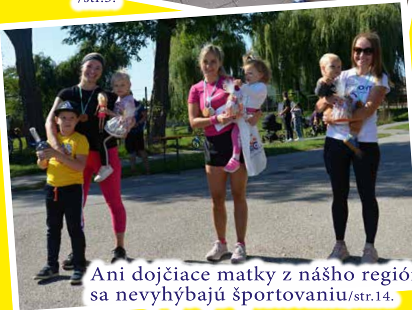
Ani dojčiacie matky z nášho regiónu sa nevyhýbajú športovaniu /str.14.