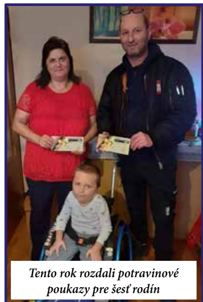
Tento rok rozdali potravinové poukazy pre šesť rodín

- Plány do budúcnosti máme veľké, ale sme ovplyvnení pandemickej situáciou a čakáme, ako sa toto celé vyvinie ďalej. Skôr by sme sa chceli na tomto mieste poďakovať každému, čo nám pomáhal, aby sme mohli pomáhať.