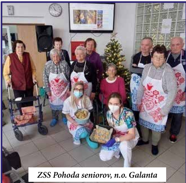
ZSS Pohoda seniorov, n.o. Galanta