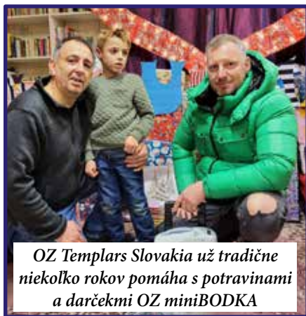
OZ Templars Slovakia už tradične niekoľko rokov pomáha s potravinami a darčekom OZ miniBODKA

• Jeseň ste mali bohatú na rôzne aktivity a pomohli ste viacerým malým deťom. Aké akcie ste organizovali počas posledných mesiacov v roku? A dalo sa vôbec niečo organizovať, keď boli v platnosti prísne epidemiologické opatrenia?