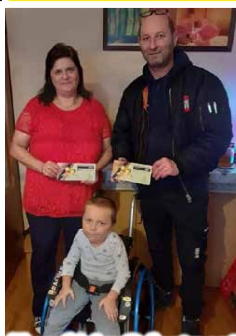
Templári z Galanty opäť pomáhali rodinám /str.7.