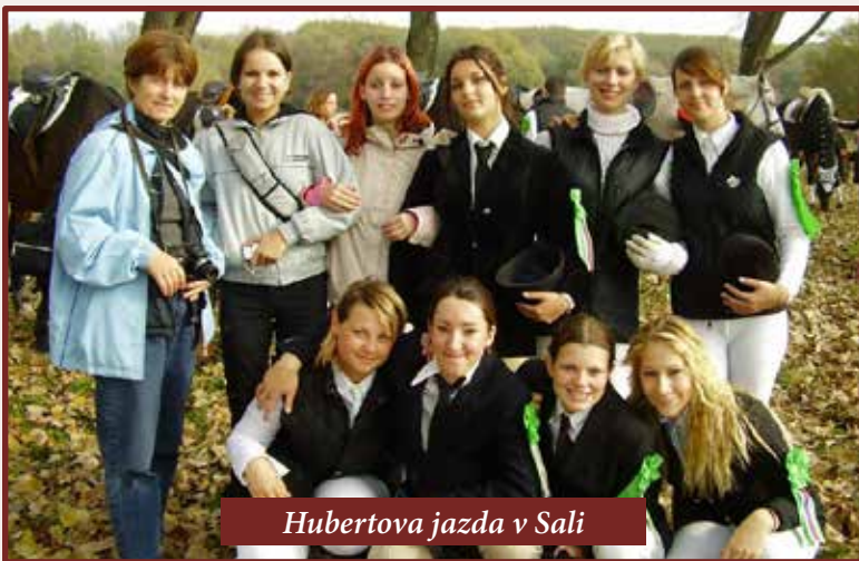
Hubertova jazda v Šali