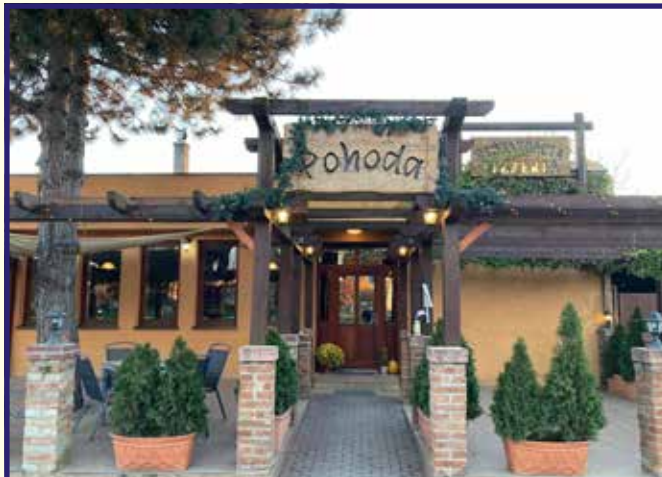
Reštaurácia Pohoda Šoporňa