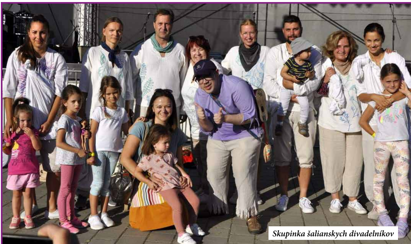
Skupinka šalienských divadelníkov