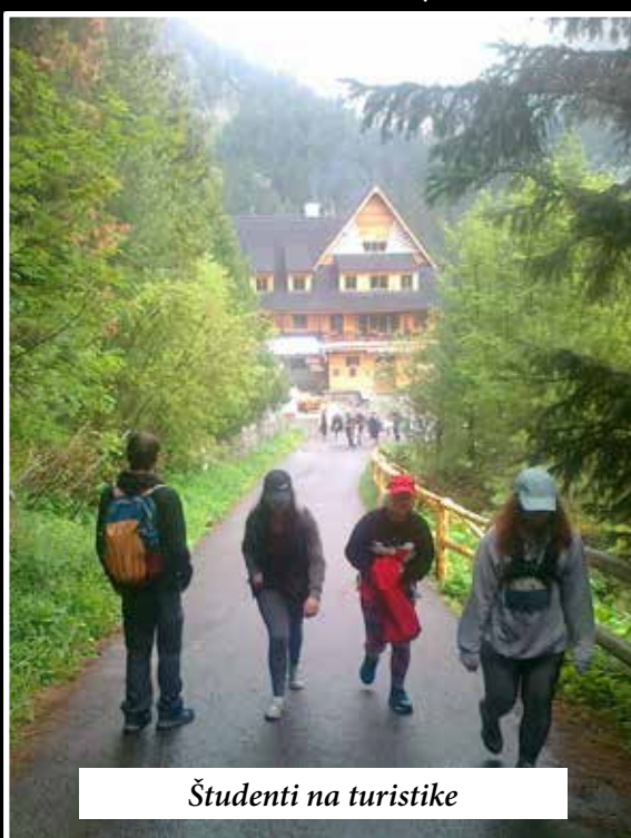
Študenti na turistike

Zahranická prax v rámci programu Erasmus+ poskytuje žiakom pracovné skúsenosti, ako aj medzinárodný certifikát vydaný Národnou agentúrou SAAIC, ktorý môžu použiť v nasledujúcom profesijnom živote. Okrem zahraničnej praxe škola poskytuje svojim študentom v zimnom období lyžiarsky a v letnom období turistický kurz. V uplynulom období žiaci našej školy sa zúčastnili turistiky v Tatranskej Lomnici. Počas tohto pobytu sa uskutočnil výstup na Skalnaté pleso, odkiaľ sa tatranskou magistrálou dostali do Veľkej studenej doliny, kde navštívili Zamkovského chatu a Hrebienok. Ďalší deň sa uskutočnila návšteva Tricklandie v Starom Smokovci, kde žiaci mali možnosť vyskúšať rôzne optické ilúzie. Ďalej navštívili 3D projekciu Poliankovo v Tatranskej Polianke. Súčasťou turistiky bol výstup na Popradské pleso, odkiaľ sa dostali turistickou cestou na Štrbské pleso. Naša škola očakáva absolventov 9. tried základných škôl aj v budúcom školskom roku v odbore 3447 K grafik digitálnych médií a absolventov učebných odborov na doplnenie maturity v rámci externého štúdia v odboroch 6317 M obchodná akadémia a 2348 M strojárstvo.