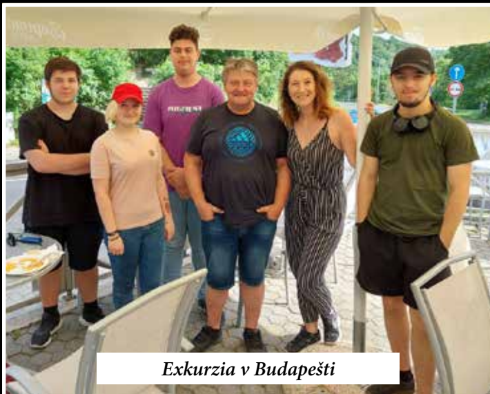
Exkurzia v Budapešti