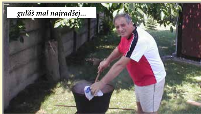
guláš mal najradšej...

nebola debata ukončená. Bol človek s veľkým „Č“, zapálený pre vec, telom a dušou kultúrnik, folklorista, divadelník. Veľmi rád pracoval s deťmi, ktoré na neho zbožne hľadeli. Jeho kamarátsky vzťah k nim bol úžasný. Nebolo snáď nikoho, kto by si ho neoblúbil. Chodil do Galanty často pracovne, veľa ako prísediaci na súde, neobišiel ma a staval sa na obed či kávičku a cigaretku, aj keď iba na chvíľu. Vždy, keď som ho stretol, mal úsmev na tvári, no v posledných mesiacoch pred smrťou bolo cítiť, že mizol úsmev, choroba umára telo a duša odchádza. Česť jeho pamiatke!