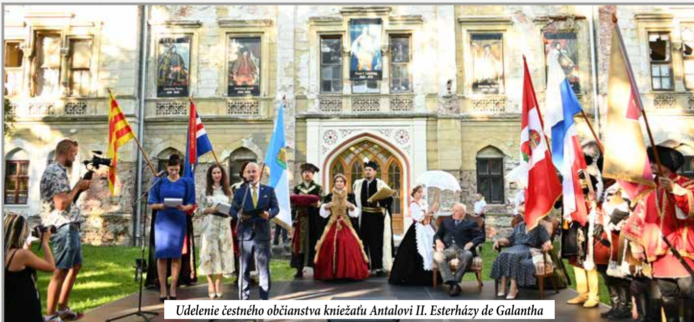
Udelenie čestného občianstva kniežatu Antalovi II. Esterházy de Galantha