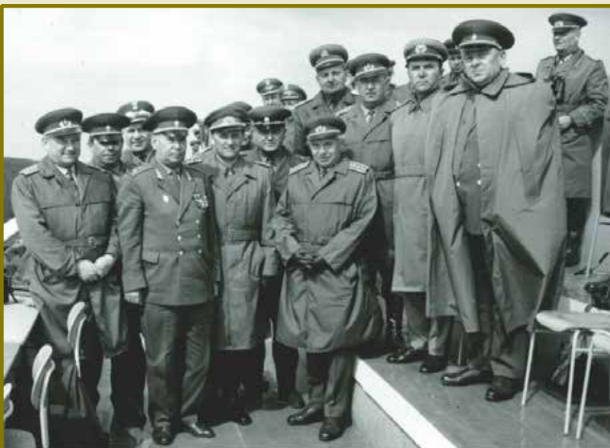
Minister národnej obrany ČSSR armádny generál Martin Dzúr (v popredí oprostred) v roku 1975