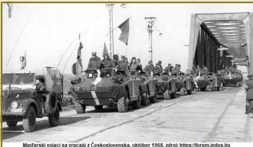
Maďarskí vojaci sa vracajú z Československa, október 1968