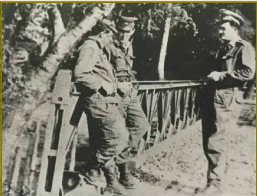
Príslušník 6. ženijného pluku s maďarskými vojakmi na moste do sereďského Kempingu, august - september 1968

Po počiatočných incidentoch pri obsadzovaní a odzbrojovaní oddelenia Verejnej bezpečnosti a kasární v Štúrove 63. motostreleckým plukom MĽA vydal minister národnej obrany ČSSR generálplukovník Martin Dzúr už o polnoci 20. augusta 1968 rozkaz, aby velitelia útvarov ČSLA ponechali vojská v kasárňach, nepoužili proti inváznym jednotkám zbrane, ale poskytli im maximálnu všestrannú pomoc a armádny generál Ivan Grigorjevič Pavlovskij zároveň nariadil neodzbrojovať útvary ČSLA, ktoré nekladú odpor, nerozmiestňovať vojská v kasárňach ČSLA, ale mimo hraníc obcí na prázdnych priestranstvách a nežiadať od veliteľov posádok ČSLA dodávky pohonných hmôt a potravín. K 6. ženijnému pluku, ktorému velil podplukovník Ing. Jaroslav Ševela, prišla iba delegácia velenia maďarského motostreleckého práporu. Príslušníci 6. ženijného pluku si udržali disciplínu a v súlade s rozkazom MNO zachovali pokoj. Kasárne 6. ženijného pluku boli obkľúčené a