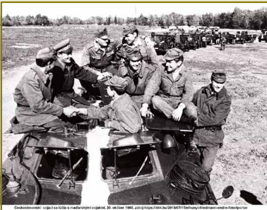
Ceskoslovenskí vojaci sa kúča s maďarskými vojakmi, 20. október 1968