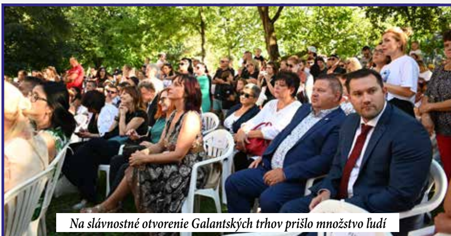
Na slávnostné otvorenie Galantských trhov prišlo množstvo ľudí