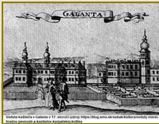
Vedľa kaštieľa v Galante v 17. storočí

bra 1682 kurucké predvoje už bojovali pozdĺž Váhu s oddielmi z palatinovho tábora v