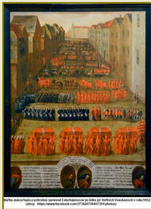
Malba znázorňujúca pohrebnú správu Esterházyovcov po bitke pri Veľkých Vozokanoch v roku 1652

no nebudeme vedieť odolať.“ Vďaka pomoci poľského kráľa Jána Sobieskeho utrpeli turecké vojská nakoniec v bitke pri Viedni 9. októbra 1683 drvivú porážku. Habsburský dvor na prelome rokov 1683 – 1684 pripravil veľkú ofenzívu. V okolí Šale sa sústredila 43-tisícová armáda pod vedením Karola V.