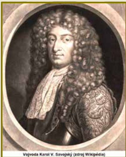
Vojvoda Karol V. Savojský