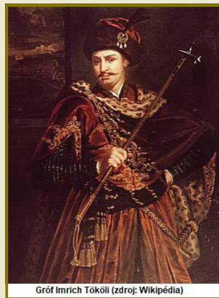
Gróf Imrich Tököli

V rokoch 1598 - 1601 Turci plienili v okolí už opevneného hradu Šintava niekoľkokrát, hrad však nedobili. Na prelome rokov 1595 a