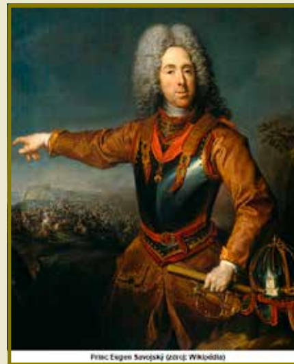
Princ Eugen Savojský