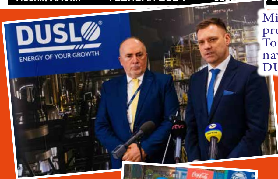
Minister životného prostredia SR Tomáš Taraba navštívil šalianske DUSLO /str. 3

Ročník XXVIII. • FEBRUÁR 2024 • časopis pre občanov okresov Galanta a Šaľa