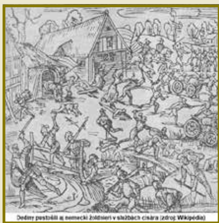
Dejiny pestovali aj nemeckí žoldnier v službách cisára