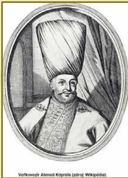
Veličkovezir Ahmed Köprülü

Séria ďalších vojenských ťažení v rokoch 1543 až 1566 umožnila začleniť do Osmanскеj ríše až 40 percent územia stredovekého uhorského štátu. V roku 1541 bola na úze-