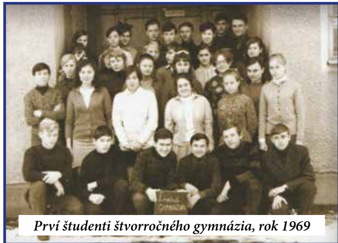
Prví študenti štvorročného gymnázia, rok 1969