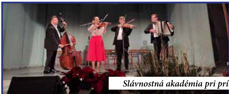
Slávnostná akadémia pri príležitosti 85. výročia gymnázia