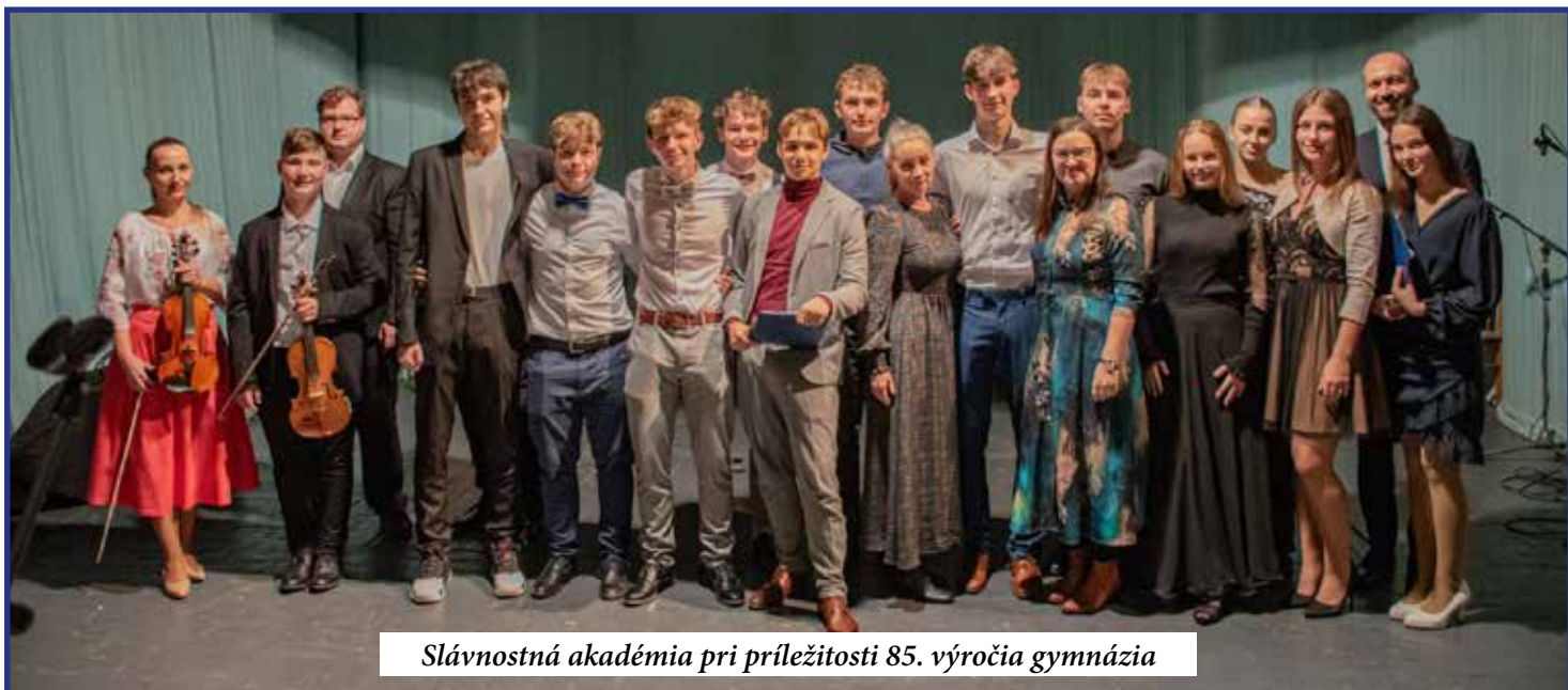
Slávnostná akadémia pri príležitosti 85. výročia gymnázia