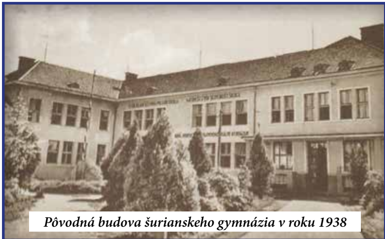
Pôvodná budova šurianskeho gymnázia v roku 1938