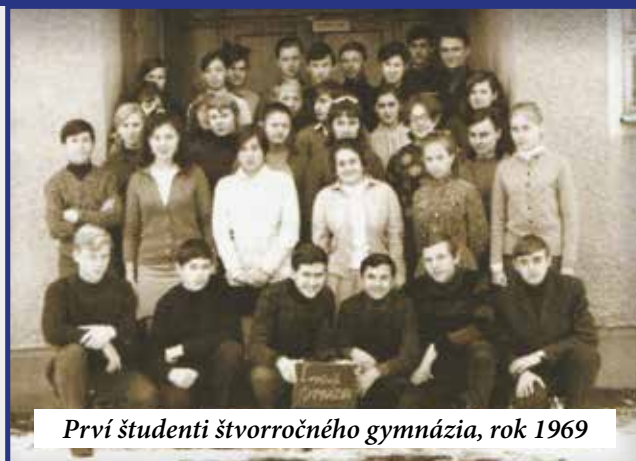
Prví študenti štvorročného gymnázia, rok 1969

Bude baterkáreň v Šuranoch výhrou, alebo prichádzame o ďalšie kusisko úrodnej zeme?