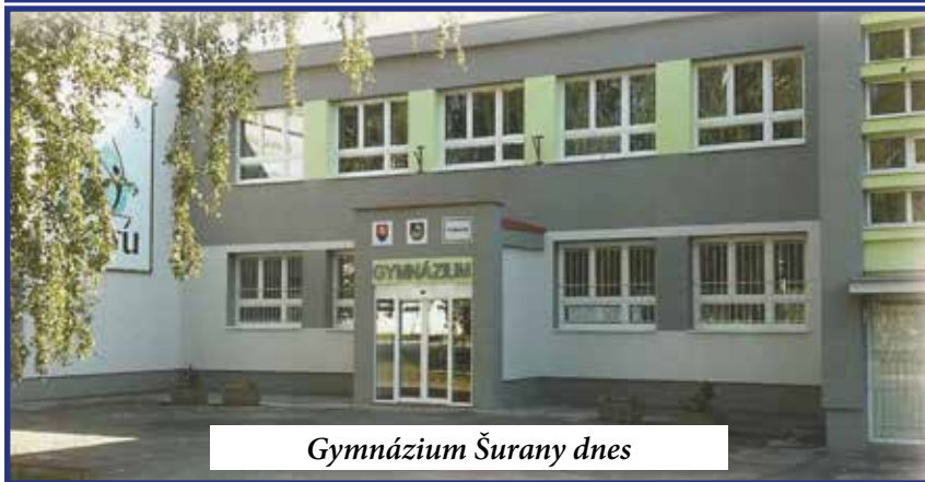
Gymnázium Šurany dnes