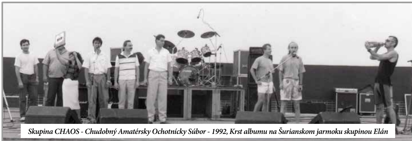
Skupina CHAOS - Chudobný Amatérsky Ochotnícky Súbor - 1992, Krst albumu na Šurianskom jarmoku skupinou Elán