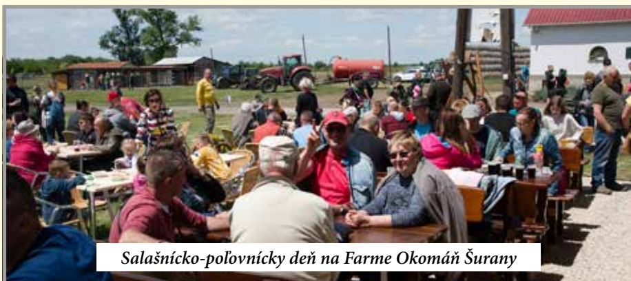
Salašnicko-poľovnícky deň na Farme Okomáň Šurany