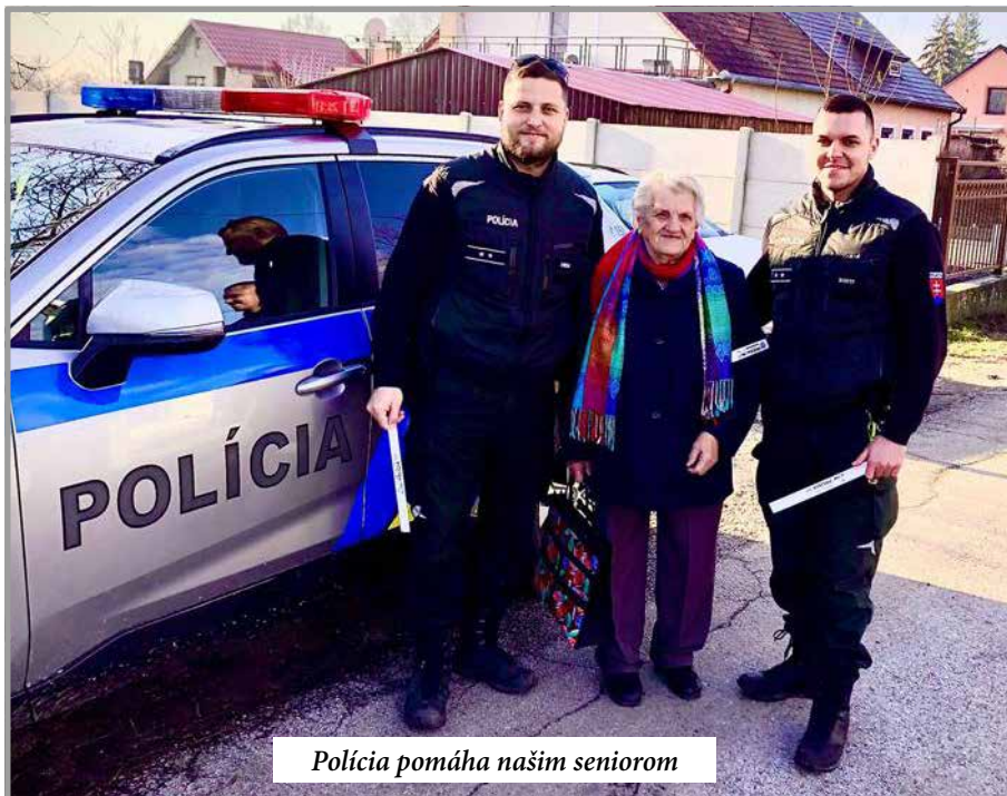
Polícia pomáha našim seniorom

- Ilegálni migranti nás priamo v našom meste, prípadne v iných častiach nášho služobného obvodu, ani veľmi nezaťažovali. Skôr sme chodili slúžiť na hraničné priechody, prípadne sme vysielali našich policajtov do Nových Zámok, kde dohliadali nad verejným poriadkom pri pracovisku cudzineckej polície, kde sa tieto skupiny osôb zhromažďovali. V súčasnosti tento problém neevidujeme.