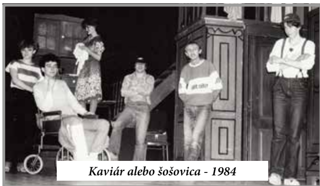
Kaviár alebo šošovica - 1984

- Áno, celé to moje poslanecské obdobie som pracoval v oblasti kultúry, avšak v dôsledku zmeny vedenia momentálne