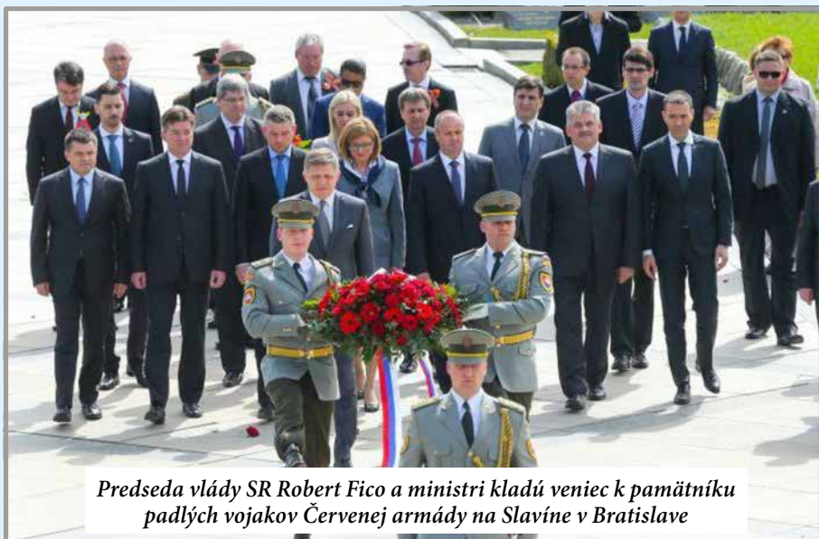
Predsa vlády SR Robert Fico a ministri kladú veniec k pamätníku padlých vojakov Červenej armády na Slavíne v Bratislave

Dokedy ešte budú všeobecní lekári a lekári súkromných ambulancií doslova vydierať vládu o stále ďalšie a ďalšie peniaze? Prečo konečne nepovedia verejnosti, aký skutočný príjem majú? Pretože občan nie je slepý a vidí, ako nadštandardne žijú a bývajú práve naši lekári. Ale aj ich pracovná doba je zaujímavá. Niekedy ledva začne o 8.00, ale o 13.00 hod. už v ambulancii nikoho nevidíme. A dovoliť sa k lekárovi je veľakrát nemožné. Mnohým našim lekárom sa veľmi páči západný štýl práce, avšak zodpovednosť a úcta k pacientovi v západných krajinách je pre nich akosi v úzadí. Skôr to tak vyzerá, akoby sa mnohí