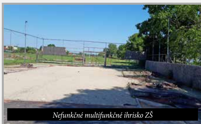
Nefunkčné multifunkčné ihrisko ZŠ

Multifunkčné športové ihrisko v areáli základnej školy dlhé roky chátralo, preto sme sa ho rozhodli taktiež zrekonštruovať: jeho celková obnova, ktorá zahŕňala úpravu nového povrchu umelým trávnikom, nové mantinely, ochranné siete a basketbalovú súpravu, bola uhrádzaná z rozpočtu obce vo výške 23.500 €. Minulý rok sa nám podarilo vybudovať na hlavnom ihrisku FC Veľký Kýr rotačný senzorový zavlažovací systém , aby sa mohla plocha trávniku rýchlejšie a jednoduchšie udržiavať. Za vybudovanie tejto závlahy sme zaplatili 11.723 €. Tento rok sme vyšli v ústrety aj miestnym hokejbalistom, ktorým sa zakúpila hracia plocha hokejbalového ihriska s mantinelmi a v areáli futbalového ihriska sme zafinancovali vyrovnanie podlažia hracej plochy asfaltom (13.000 €). Žiaľ, aj realizácia tohto projektu trvala zo strany dodávateľa veľmi dlho, ale verím tomu, že z nového ihriska budú mať radosť nielen hokejbaloví hráči, ale aj deti a mládež, ktorí budú mať možnosť využiť toto ihrisko na korčuľovanie, aby sa v obci spopularizoval aj ďalší druh športu.