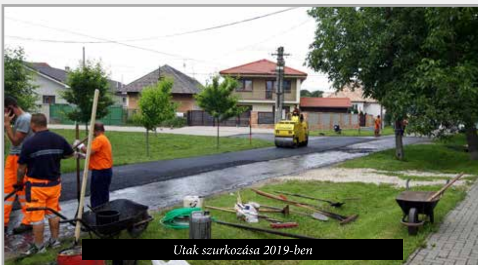
Utak szurkozása 2019-ben