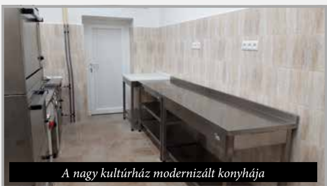
A nagy kultúrház modernizált konyhája