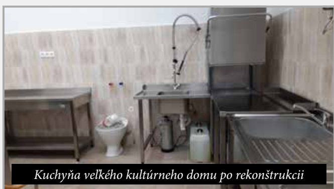
Kuchyňa veľkého kultúrneho domu po rekonštrukcii