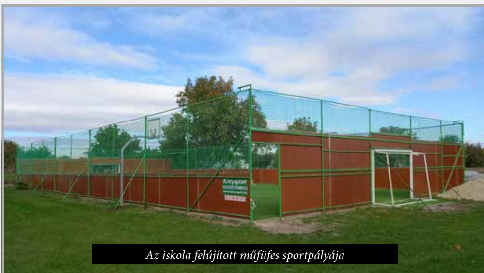
Az iskola felújított műfüves sportpályája