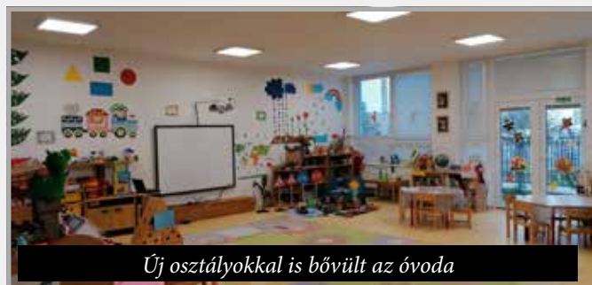
Új osztályokkal is bővült az óvoda