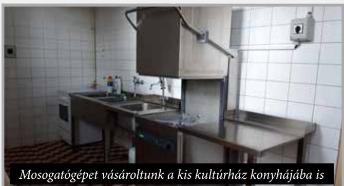
Mosogatógépet vásároltunk a kis kultúrház konyhájába is

Úgy, ahogy az előző választási időszakban, most is igyekeztünk fokozatosan modernizálni meglévő középületeinket: