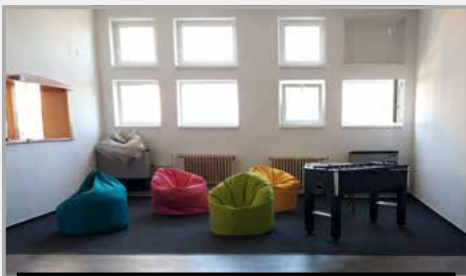
Ifiklub létesítése a nagy kultúrház emeletén