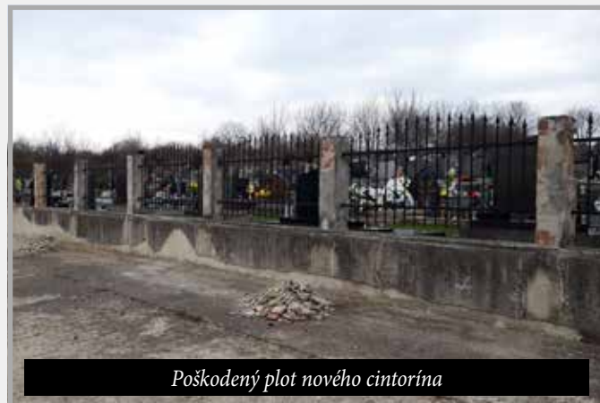
Poškodený plot nového cintorína

Z rozpočtu obce sa každoročne snažíme zrekonštruovať obecné sakrálné sochy a pamätníky. Počas tohto volebného obdobia bola zreštaurovaná socha sv. Anny na Nitrianskej ulici, súsošie starého cintorína a bol obnovený pamätník civilných obetí II. sv. vojny na starom cintoríne (19.500 €). Za opravený plot nového cintorína sme zaplatili 2.305 € a miestnej farnosti rímskokatolíckej cirkvi sme z rozpočtu obce počas 4-ročného obdobia poskytli nenávratnú dotáciu vo výške 19.000 €, ktorá bola použitá na rôzne účely rekonštrukcie miestneho kostola a jeho okolia.