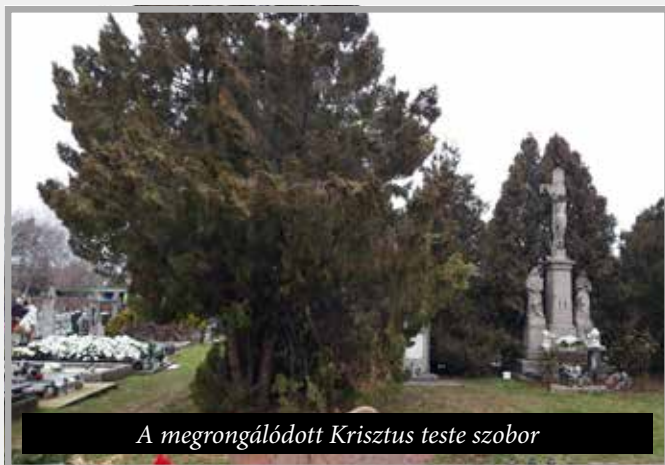
A megrongálódott Krisztus teste szobor