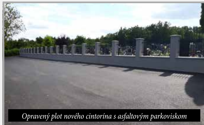
Opravený plot nového cintorína s asfaltovým parkoviskom