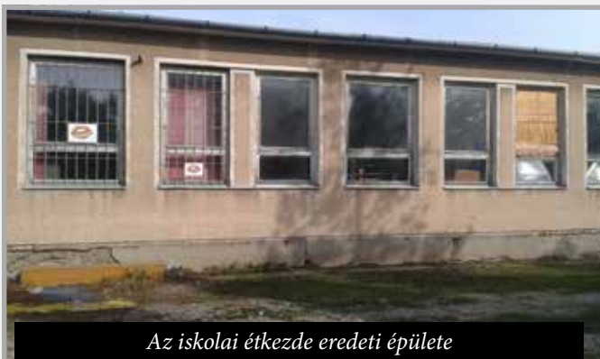
Az iskolai étkeзде eredeti épülete