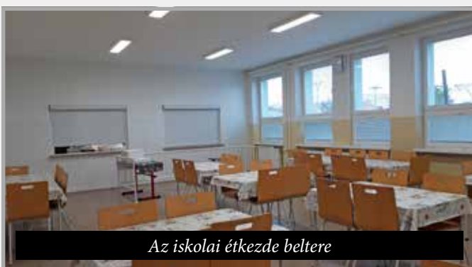
Az iskolai étkeзде beltére

4.181 € volt). Az óvoda új kerítését 5.135 €-ért szereztük be. Ez év szeptemberében sikerült megoldanunk az új temető ravatalozója előtti tér lefedését (51.341 €), hogy megvédjük a temetésen résztvevőket az időjárás viszontagságai elől.