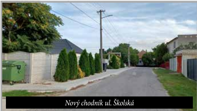
Nový chodník ul. Školská