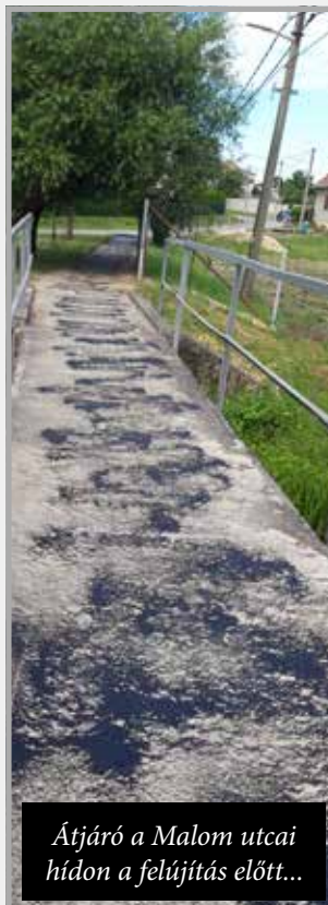
Átjáró a Malom utcai hídon a felújítás előtt...