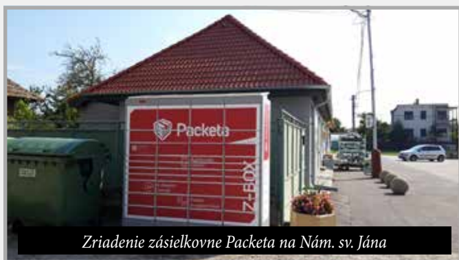
Zriadenie zásielkovne Packeta na Nám. sv. Jána

tovarov do úložných boxov PACKETA a spustili sme aj ďalšiu službu pre občanov: mobilný rozhlas – pomocou aplikácie MUNIPOLIS , pomocou ktorej dostávajú záujemcovia najdôležitejšie informácie o dianí v obci priamo do svojho mobilného telefónu.