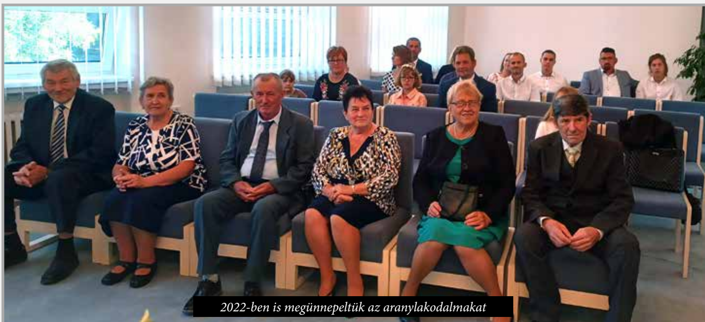
2022-ben is megünnepeltük az aranylakodalmakat

Az elmúlt 4 évben a község költségvetéséből 115.000 € dotációt nyújtottunk az érdekszervezetek munkájának megsegítésére és ezekkel a szervezetek el is számoltak. Évente megrendeztük a disznótoros kóstolást, májusfa-állítást, falunapot, bűcsút; megünnepeltük a kerek évfordulós nyugdíjas jubileumokat (pandémia végett 2019 kivételével), valamint az arany-és ezüstlakodalmas házaspárok évfordulóit. Az újszülöttek szüleit 8. éve megajándékozuk anyagi és tárgyi ajándékkal. A 2021-es évtől megemeltük a község anyagi hozzájárulását a 70 éven feletti nyugdíjasok étkeztetéséhez és az idei évtől 10 €-s értékben kerülnek majd kifizetésre a 70 éven feletti lakosok karácsonyi utalványai.