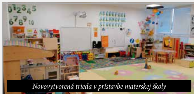
Novovytvorená trieda v prístavbe materskej školy