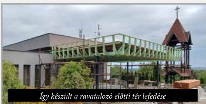
Így készült a ravatalozó előtti tér lefedése