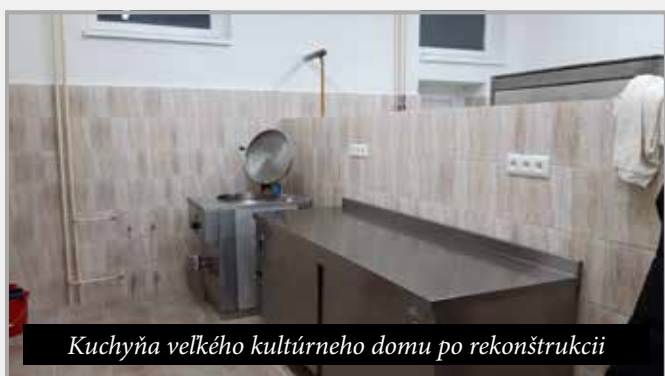
Kuchyňa veľkého kultúrneho domu po rekonštrukcii