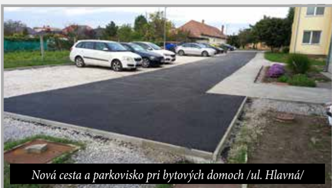
Nová cesta a parkovisko pri bytových domoch /ul. Hlavná/