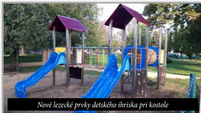
Nové lezecké prvky detského ihriska pri kostole