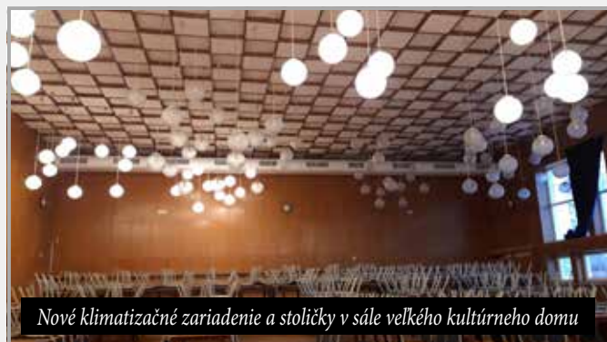
Nové klimatizačné zariadenie a stoličky v sále veľkého kultúrneho domu

Do malého kultúrneho domu sme taktiež dali namontovať kli-