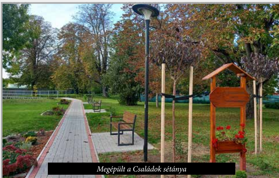
Megépült a Családok sétánya

belevetítik majd a szemétszállítási díjba. Erre pedig sajnos megint csak a lakosok fognak ráfizetni, mert ez már mindenki számára a szemétdíj emelését fogja eredményezni.