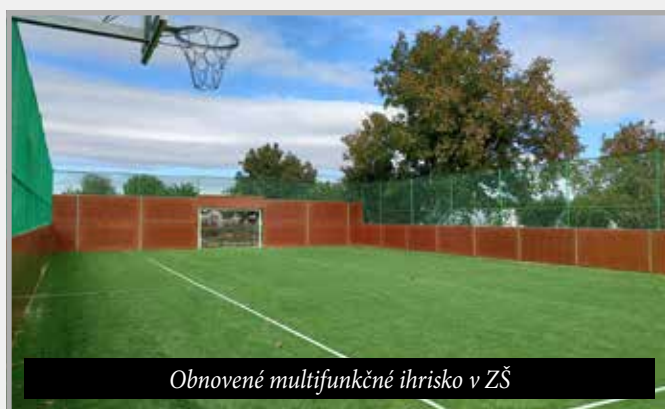
Obnovené multifunkčné ihrisko v ZŠ