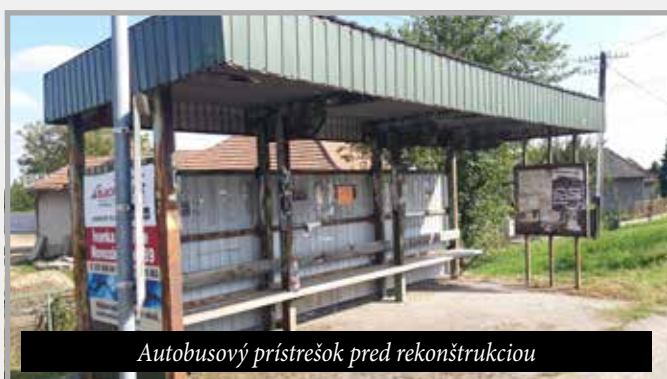
Autobusový prístrešok pred rekonštrukciou

Začiatkom tohto volebného obdobia sme z dôvodu bezpečnej jazdy vymenili z vlastných zdrojov na území celej obce dopravné značky za certifikované (20.465 €) a v Malom Kýre na ul. Novozámocká sa nám podarilo dobudovať dlho očakáva-