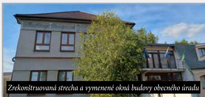
Zrekonštruovaná strecha a vymenené okná budovy obecného úradu