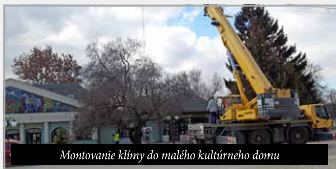
Montovanie klímy do malého kultúrneho domu