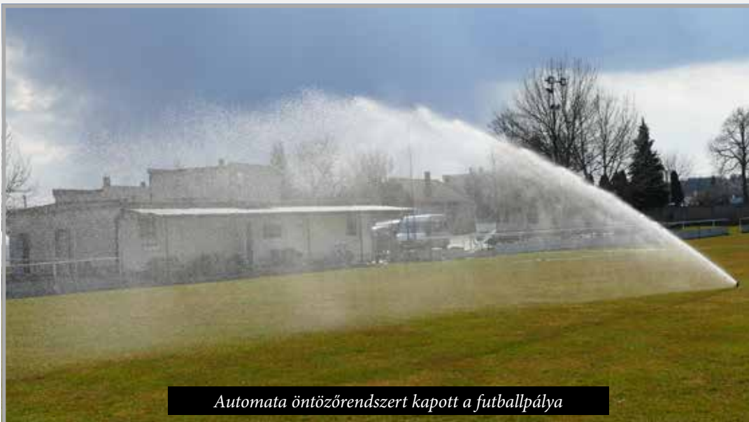
Automata öntözőrendszert kapott a futballpálya

újítására (a pályázat 13.577 €-ját a község már kifizette, várunk még a visszatérítésre). Ennek a játszótérnek a homokozóját önköltségből takartuk le (1.200 €) és a templom melletti játszótérre is új körhinták és mászófalas csúszda került (9.114 €). Jelenleg a kultúrparkba tervezett látványos CSALÁD inkluzív játszótér megépítésére várunk, amely nagy mászófalas kalózhajóból, új hintákból, kötélpályából, valamint mozgáskorlátozott gyermekek részére tervezett hintákból és homokozóból fog állni. A projekt megvalósítása a kivitelező vállalat elfoglaltságától függően év végéig várható és a Szlovák munkaügyi-és szociális minisztérium 50.000 €-s támogatásának köszönhetően fog létrejönni.