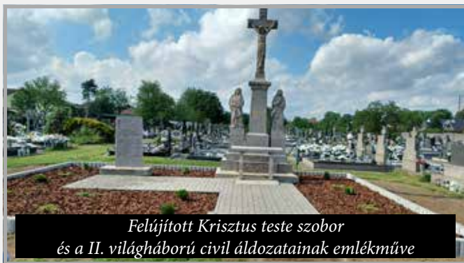
Felújított Krisztus teste szobor és a II. világháború civil áldozatainak emlékműve

A községi hangosbemondó felújítására 16.087 €-t költöttünk. Az új temetőből gyalogosjárdát építettünk (11.800 €), a biztonságos közlekedést itt szenzoros napelemes lámpákkal oldottuk meg (6.610 €) és ugyanilyen lámpák kerültek a templom melletti Családok sétányára is. A buszmegállóba új szemétkosarakat, valamint a közterületre parki padokat és szemétkosarakat vásároltunk 3.500 € összértékben.