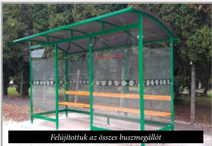
Felújítottuk az összes buszmegállót