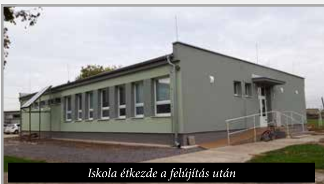
Iskola étkeзде a felújítás után

szükséges volt elvégezni, de a támogatás ezeket nem tartalmazta (padlóburkolatok, csempézés, festés, fűtőtestek cseréje, szociális helységek felújítása). A teljesen felújított étkeзде konyhájába rozsdamentes munkaasztalokat, mosogatógépet, többfunkciós konvekciós sütőt és melegítőt vásároltunk (12.200 €), így a teljesen megújult épületért senkinek sem kell már szégyenkeznie. Büszke vagyok, hogy a 2020-as pandémiás évben 3 hónapos rekordidőben sikerült elvégeznünk az óvodabővítési tervet a Szlovák Mezőgazdasági- és Régiófejlesztési Minisztérium 288.214,63 €-s támogatásával, amelyhez 15.169 € önrész társult. Ezenfelül saját költségből fedeztük a hozzáépített óvodarész vízelvezetését (5.500 €), valamint a két új óvodaterembe napellenzőket szereltettünk, új szőnyeget vásároltunk és az óvoda kiskonyhájába a személyzet munkájának megkönnyítése végett szintén mosogatógépet vásároltunk (ezen kiadások összértéke