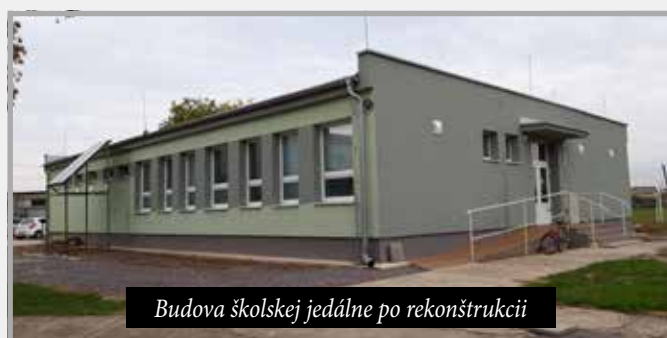
Budova školskej jedálne po rekonštrukcii