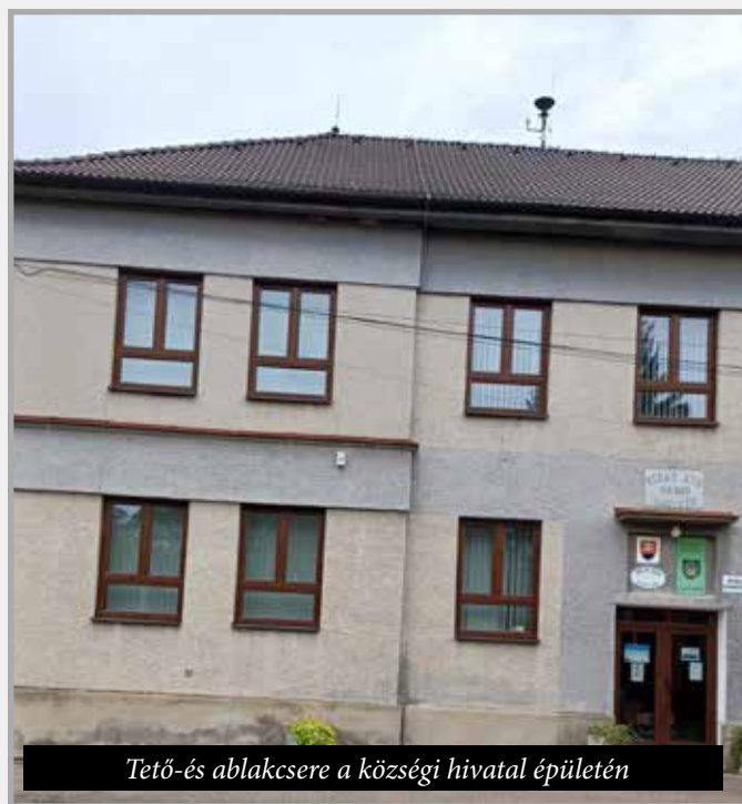
Tető-és ablakcsere a községi hivatal épületén

A nagy kultúrház nagytermének lecseréltük a székeit (4.248 €) és villanyégőit (2.500 €); a volt bár megüresedett helységeit átalakítottuk ifjúsági klubbá (3.000 €), teljesen felújítottuk az épület 40 éves konyháját (új villanyvezeték, csempe- és padlóburkolat; rozsdamentes acél berendezést, új hűtőt és mosogatógépet vásároltunk, amelyek összértéke 16.920 €-t tett ki); a nyugdíjasklub is új berendezést kapott (380 €) és a felújítás legnagyobb ösz-