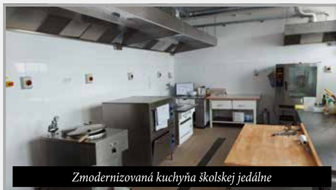
Zmodernizovaná kuchyňa školskej jedálne

dosiahli vďaka zakúpeniu žltých zberných nádob na triedenie plastov (1.880 €), 600l kompostérov do domácností na likvidáciu bioodpadu (18.790 €), začipovaním zberných nádob komunálneho odpadu (3.000 €) a prevádzkovaním zberného dvora. Na odpadové hospodárstvo obec v súčasnosti vôbec nedopláca, za vysoké percento triedenia odpadov sme dokonca v r. 2021 a 2022 dostali dotáciu z Environmentálneho fondu a zachovali sme aj najnižší poplatok za TKO v regióne (17,15 €/občan , pričom sa tieto poplatky inde pohybujú na úrovni 27-33 €/osoba). Mám však veľké obavy zo zmeny zákona o odpadoch, ktorý s účinnosťou od budúceho roka prikazuje zberným spoločnostiam ukladať na skládky odpadov iba upravený komunálny odpad, čím budú nútení vlastné investičné náklady premietnuť