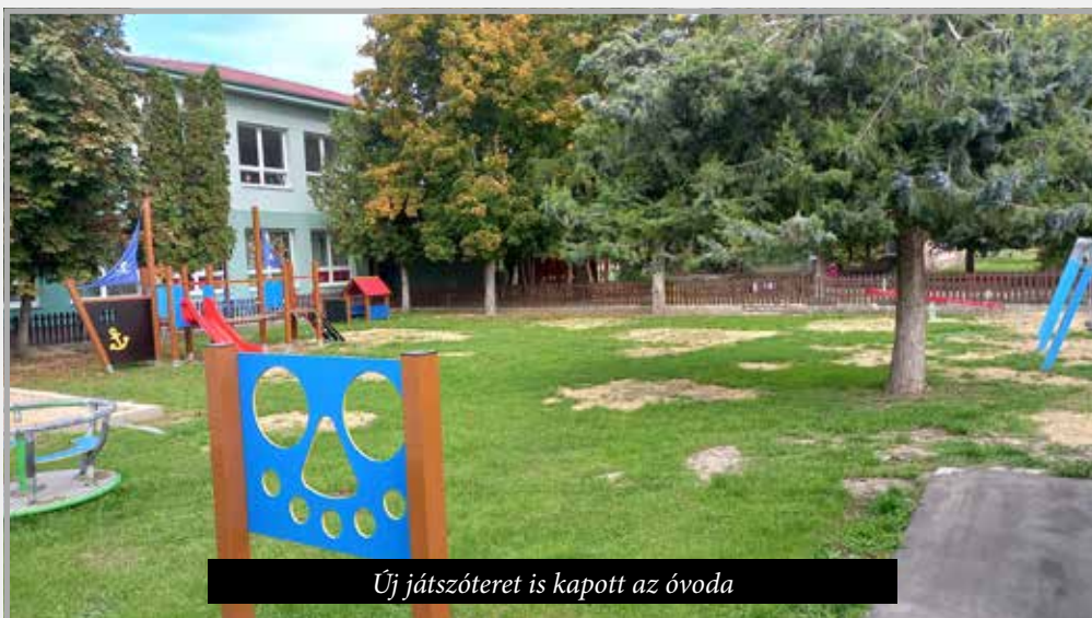
Új játszótér is kapott az óvoda

A választási időszak elején a biztonságos közlekedés végett saját költségből cseréltük le a község összes közlekedési tábláját (20.465 €) és sikerült befejezni Kiskéren az Ujvári utca 300 méteres járdaszakaszát (15.957 €). Hosszantartó folyamat volt ez, mivel a Szlovák útigazgatástól saját tulajdonba kellett szerezni a járda alatti területet. A régi buszmegálló cseréjét eredetileg pályázat segítségével szeretnénk volna megoldani, de 2 év megoldhatatlan akadály legyűrése miatt végül ezt a tervet is saját költségből fedeztük és kevesebb, mint 3 hónap alatt le is bonyolítottuk (16.330 €). Ez a projekt egy jó példa arra, milyen feleslegesen komplikált hazánkban a pályázatok adminisztrációja a támogatást nyújtó szervek részéről. A község több részén térköves gyalogosjárdát létesítettünk (öreg temető futballpálya feletti parkolója, alapiskola parkolója, Gesztenye utca és a templom híddal összekötött járdája, az Iskola utcai járda – összköltségük 12.030 €) és a 4 év alatt leszurkoztattunk 7.870 m 2 utat , járdát, parkolót, beleértve a kátyúk javítását is (188.588 €).