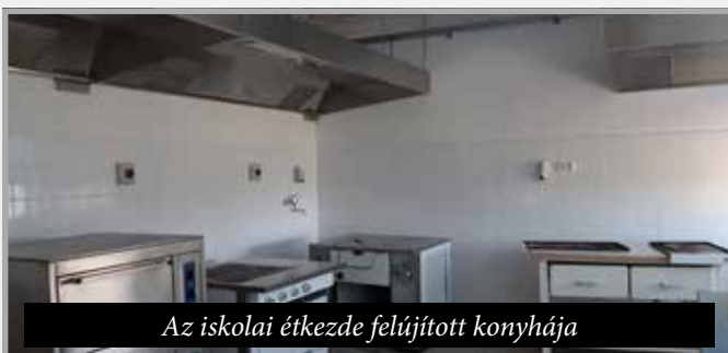
Az iskolai étkeзде felújított konyhája

szükséges volt elvégezni, de a támogatás ezeket nem tartalmazta (padlóburkolatok, csempézés, festés, fűtőtestek cseréje, szociális helységek felújítása). A teljesen felújított étkeзде konyhájába rozsdamentes munkaasztalokat, mosogatógépet, többfunkciós konvekciós sütőt és melegítőt vásároltunk (12.200 €), így a teljesen megújult épületért senkinek sem kell már szégyenkeznie. Büszke vagyok, hogy a 2020-as pandémiás évben 3 hónapos rekordidőben sikerült elvégeznünk az óvodabővítési tervet a Szlovák Mezőgazdasági- és Régiófejlesztési Minisztérium 288.214,63 €-s támogatásával, amelyhez 15.169 € önrész társult. Ezenfelül saját költségből fedeztük a hozzáépített óvodarész vízelvezetését (5.500 €), valamint a két új óvodaterembe napellenzőket szereltettünk, új szőnyeget vásároltunk és az óvoda kiskonyhájába a személyzet munkájának megkönnyítése végett szintén mosogatógépet vásároltunk (ezen kiadások összértéke