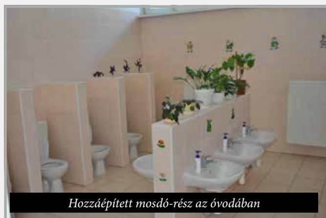
Hozzáépített mosdó-rész az óvodában

lett sikerült megtartanunk a régió legalacsonyabb személyre szóló éves szemétdíját (17,15 €/fő, miközben ez az illeték máshol már 27-33 €-t tesz ki fejenként). A jövő évtől érvénybe lépő új szeméttörvény kellemetlen változásokat fog hozni, mivel a szemétszállító vállalatok a hulladéklerakatokra csak megmunkált hulladékot rakhatnak le, így a saját investíciós költségeiket