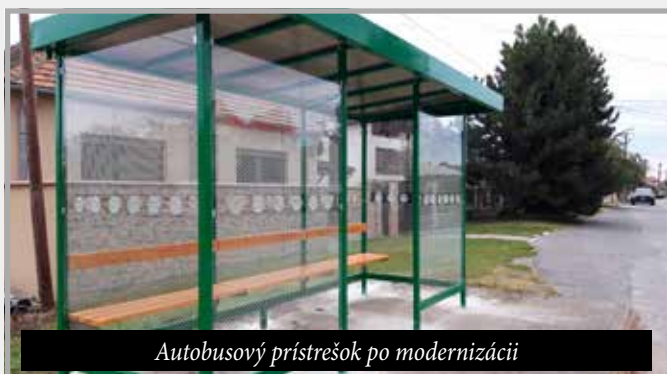
Autobusový prístrešok po modernizácii

ný, cca 300 m dlhý chodník smerom od benzínového čerpadla (15.957 €). Bol to dlhotrvajúci projekt, pretože sme od Slovenskej správy ciest museli najprv získať pozemok pod chodníkom do nášho vlastníctva. Výmenu 5 autobusových prístreškov sme pôvodne plánovali realizovať pomocou dotácie, ale po vyše 2-ročných neriešiteľných prekážkach sme tento projekt nakoniec financovali z vlastných zdrojov (16.330 €) a zrealizovalo sa to za necelé 3 mesiace. Aj tento projekt potvrdzuje, že administrácia zo strany poskytovateľov dotácie je zbytočne komplikovaná. Na jednotlivých miestach obce boli z vlastných zdrojov vybudované chodníky zo zámkovej dlažby (parkovisko starého cintorína, parkovisko pri základnej škole, spojovací chodník od lávky ku kostolu, chodník na ul. Školská – celkom za 12.030 €) a počas 4-ročného obdobia sa vyasfaltovalo spolu 7 870 m 2 miestnych komunikácií, odstavných a parkovacích plôch a chodníkov vrátane opravených cestných výtlkov (188.588 eur). Do rekonštrukcie miestneho rozhlasu sme investovali 16.087 €. Novovybudovaný odjazdový chodník nového cintorína (11.800 €) sme osvietili senzorovými solárnymi svietidlami (6.610 €) a rovnaké svietidlá boli osadené aj pri Chodníku rodín pri miestnom kostole. Zakúpili sa aj parkové lavičky, parkové smetné koše a odpadkové koše do autobusových prístreškov (3.500 €).