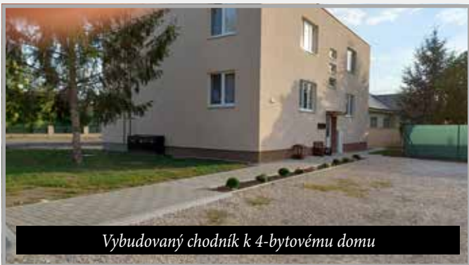
Vybudovaný chodník k 4-bytovému domu

do zvýšenia poplatkov za odvoz odpadu. Zákonnodarcov však netrápi, že na to doplatí znova iba bežný občan, preto sa obrovskému zvyšovaniu poplatkov za odpady v budúcom roku pravdepodobne nikto nevyhne (ani naša obec). Aby sme zefektívili starostlivosť o verejnú zeleň , zakúpili sme multifunkčnú kosačku s mulčovačom (12.000 €), okrem toho sme každoročne pokračovali v boji proti ploskáčikovi pagaštanovému postrekaním gaštanovej aleje pozdĺž rieky Nitra. Na výsadbu nových stromov sme získali dotáciu z grantu Zelené obce (16.424 €) a napriek tomu, že máme platnú zmluvu z r. 2019, projekt sa zatiaľ nezrealizoval z dôvodov na strane poskytovateľa dotácie (Slovenská agentúra ŽP). V spolupráci so Západoslovenskou vodárenskou spoločnosťou sme pomohli dobudovať posledný úsek verejného vodovodu ul. Sv. Kelemena , čím je vybudovaný vodovod na území celej obce. Taktiež sa dokončila výstavba optickej internetovej siete spol. Slovak Telekom – v súčasnosti postupne napájajú na sieť jednotlivé ulice a bol zrealizovaný aj projekt „Wifi pre Teba v obci Veľký Kýr“, ktorý zatiaľ poskytovateľovi dotácie nie je vyúčtovaný.