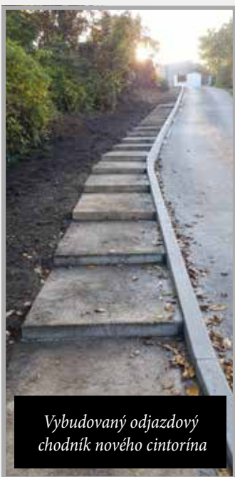
Vybudovaný odjazdový chodník nového cintorína