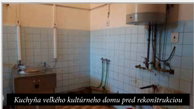
Kuchyňa veľkého kultúrneho domu pred rekonštrukciou

Na zníženie energetickej náročnosti oboch kultúrnych domov sme začiatkom roka 2022 získali dotáciu v celkovej výške 1.304.176 € ale z dôvodu nariadeného opakovaného vykonania verejného obstarávania stavebných prác a zdĺhavých kontrolných činností zo strany poskytovateľa dotácie (Slovenská