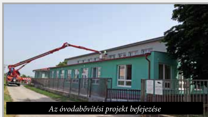
Az óvodabővítési projekt befejezése

Az elmúlt 4 év szemétagdálkodása nagy eredményének a közösségekben kitermelt kommunális hulladék lecsökkentését tartom 900 tonnáról 466 t és a szelektálás növelését 10%-ról 62%. Ennek az eredménynek az eléréséhez hozzájárult a műanyag osztályozásához szükséges sárga kukáknek a vásárlása (1.880 €), 600 literes komposztálók vásárlása a háztartásaink lebomló hulladékának komposztálásához (18.790 €), a fekete kukák elektronikus csipelése (3.000 €) és a gyűjtőudvar üzemeltetése. Szemétagdálkodásunk kiadásai évek óta fedezetek, a magas szintű hulladék-szelektálásért a 2021-es és a 2022-es évben az Environmentális fondból támogatást is nyertünk. Mindezek mel-