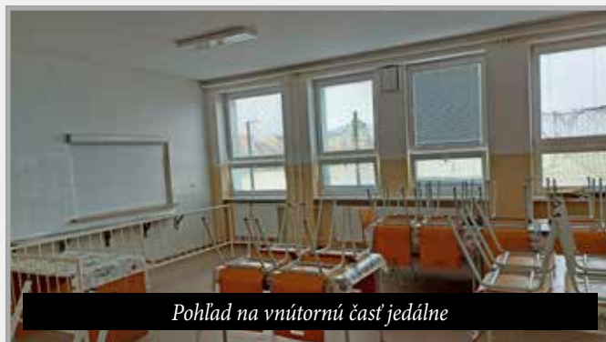
Pohľad na vnútornú časť jedálne