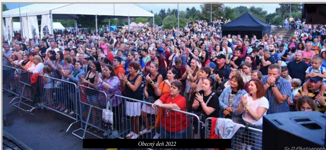
Obecný deň 2022