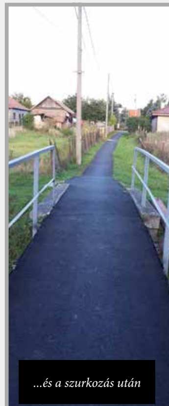
...és a szurkozás után