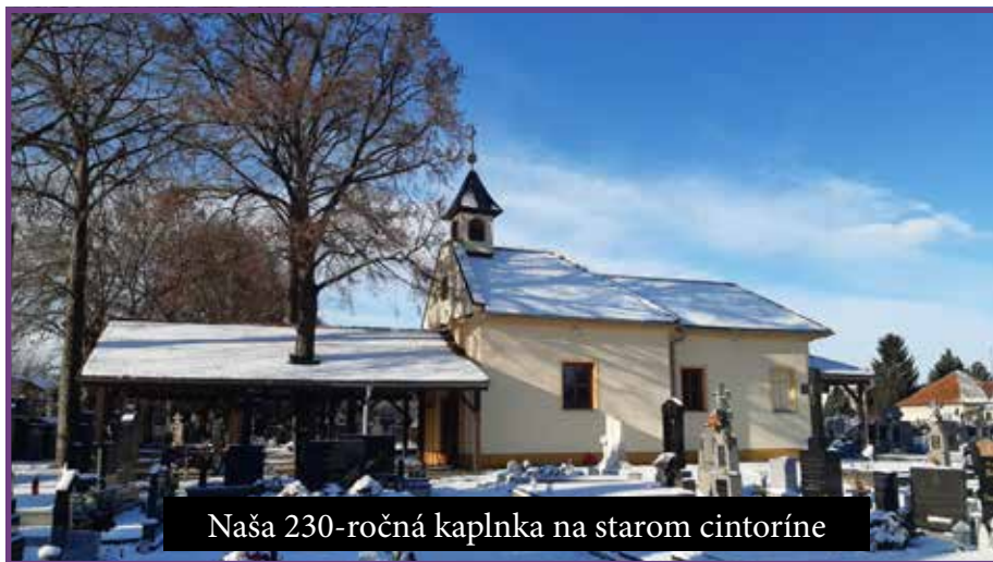
Naša 230-ročná kaplnka na starom cintoríne

stala medený povrch s novým krížom. Budova kaplnky bola rozšírená o sakristiu, chladiacu miestnosť a prístrešok, na ktorý sa opäť vrátil nápis „Feltámdunk!“. Vľavo od kaplnky je 225-ročný