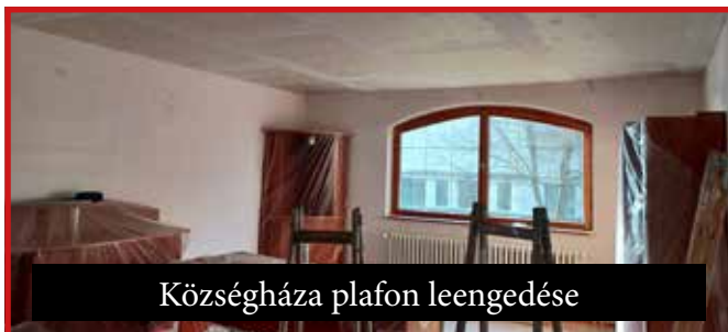
Községháza plafon leengedése

Ennek ellenére a képviselőtestületünk által támogatott terveinket fokozatosan teljesítjük: az év eleje óta befejeztük a Fő utcai beteg tujafák kivágását; a ravatalozó térkövének lerakását; energiacsökkenés miatt elvégeztük a községi hivatal új épületében a mennyezetek hőszigetelését és lámpacseréjét, valamint ugyanebből az okból energiatakarékos lámpákra cseréltük az új temető feljáróján a régi villanyokat is. Köszönet a község alkalmazottjainak és a megbízott vállalkozóknak, hogy az említett munkákat