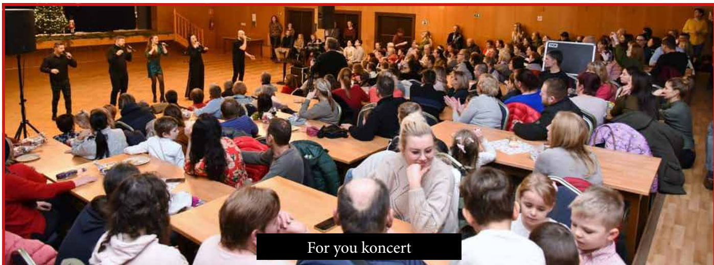
For you koncert