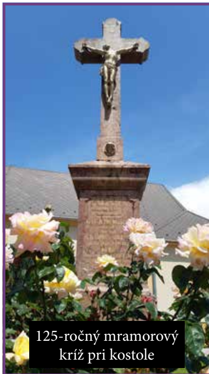
125-ročný mramorový kríž pri kostole