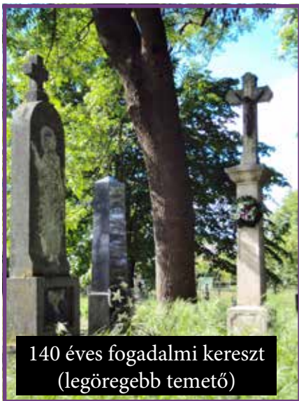
140 éves fogadalmi kereszt (legöregebb temető)

Ebben az évben ünnepeljük a község első írásos feljegyzésének 910. évfordulóját, ugyanakkor néhány szagrális emlékművünk is kerek évfordulót ünnepel: