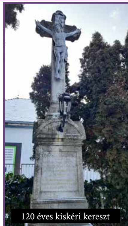
120 éves kiskéri kereszt

A kiskéri kereszt lépcsős talapzatán a híd mellett 120 éves. A keresztet a Kis-