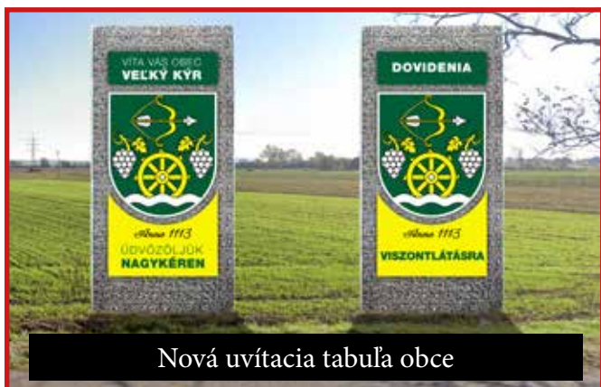
Nová uvítacia tabuľa obce

da svojimi nesprávnymi rozhodnutiami neustále sťažuje fungovanie samospráv; mestá a obce využíva ako bankomaty na financovanie svojich sľubov (napr. vyplácanie daňových bonusov zo skráteného výnosu podielových daní obcí, alebo nútenie financovania výdavkov neštátnych sociálnych zariadení z rozpočtu samospráv, atď.). Napriek týmto problémom sa snažíme plány obecného zastupiteľstva našej obce postupne realizovať: od začiatku roka sme ukončili odstránenie chorobou napadnutých tují na ulici Hlavná; pri dome smútku sme uložili plánovanú zámkovú dlažbu; z dôvodu zníženia nákladov na energie sme znížili a zateplili stropy v prístavbe obecného úradu a vymenili sme tu aj svietidlá za úsporné. Z rovnakého dôvodu sa vymenili aj staré svietidlá prístupovej cesty nového cintorína za LEDkové. Poďakovanie patrí zamestnancom obce a podnikateľským subjektom,