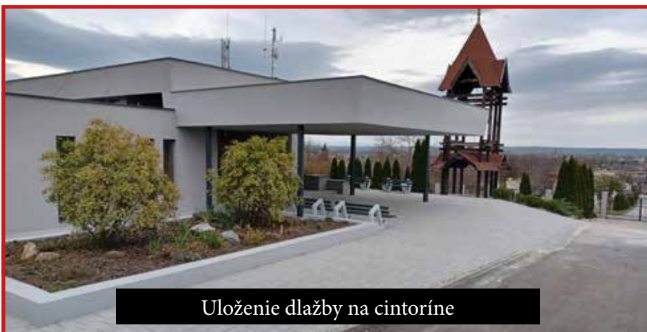
Uloženie dlažby na cintoríne