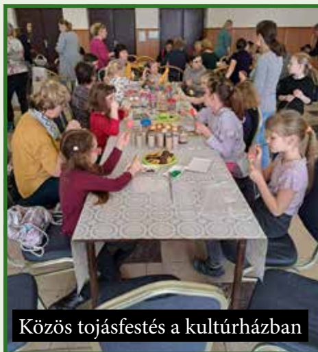
Közös tojásfestés a kultúrházban

csolása, hanem a szürke hétköznapokból való kiszakadásra is lehetőséget nyújtanak. Legutóbbi lehetőség a közös találkozásra, közösségünk javára április 21-én volt a „Föld napja” alkalmából – a falu és a szervezetek együttes szervezésében meghirdetett falutakarításon. Április 23-án a „Made in Hungaria” című magyar nyelvű musical került megrendezésre, április 30-án pedig