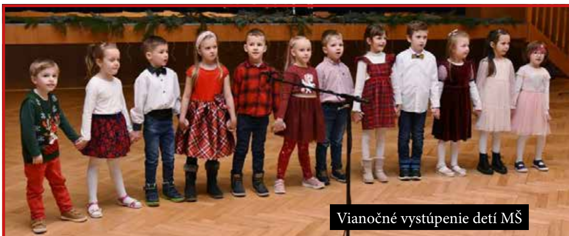
Vianočné vystúpenie detí MŠ

Pozvanie na rodinnú batôžkovú zábavu do veľkého kultúrneho domu prijali desiatky rodín, a tak sa so starým rokom lúčili za spoločného tanca bratanci a sesternice, susedia i kolegyně; nezáležalo na veku, každý sa tešil na tombolu a polnočný ohňostroj. Pamätne bude, že bolo nezvyčajne teplo tak v noci, ako aj na nový rok. V prvom vysielaní obecnej TV sa obyvateľom prihovorila pani starostka, ktorá mimochodom takisto vyzdvihla aktívnu činnosť obyvateľov obce pôsobiacich v rôznych športových a kultúrno-spoločenských organizáciách. Traja králi roznašali