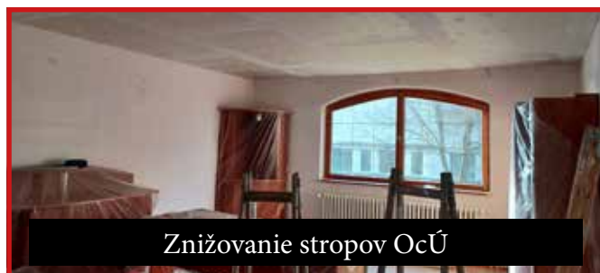
Znižovanie stropov OcÚ

da svojimi nesprávnymi rozhodnutiami neustále sťažuje fungovanie samospráv; mestá a obce využíva ako bankomaty na financovanie svojich sľubov (napr. vyplácanie daňových bonusov zo skráteného výnosu podielových daní obcí, alebo nútenie financovania výdavkov neštátnych sociálnych zariadení z rozpočtu samospráv, atď.). Napriek týmto problémom sa snažíme plány obecného zastupiteľstva našej obce postupne realizovať: od začiatku roka sme ukončili odstránenie chorobou napadnutých tují na ulici Hlavná; pri dome smútku sme uložili plánovanú zámkovú dlažbu; z dôvodu zníženia nákladov na energie sme znížili a zateplili stropy v prístavbe obecného úradu a vymenili sme tu aj svietidlá za úsporné. Z rovnakého dôvodu sa vymenili aj staré svietidlá prístupovej cesty nového cintorína za LEDkové. Poďakovanie patrí zamestnancom obce a podnikateľským subjektom,