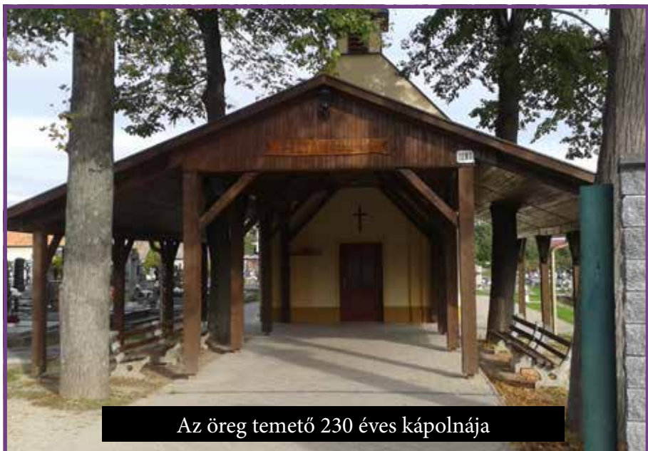
Az öreg temető 230 éves kápolnája