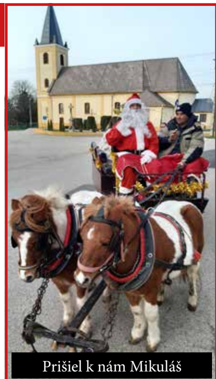
Prišiel k nám Mikuláš

Prišiel Silvester. Kostol zaplnili veriaci, pre ktorých k tomuto dňu neodmysliteľne patrí aj ďakovná sv. omša. Vždy je zaujímavé vypočúť si bilanciu za uplynulý rok – a tentokrát konečne tak pozitívnu, že sa v našej farnosti v roku 2022 narodilo viac detí, než koľko bolo zosnulých.