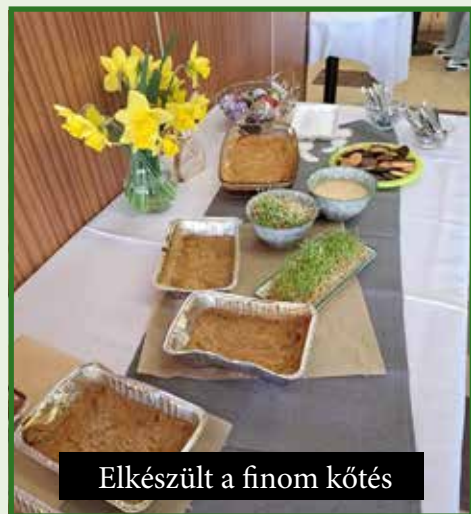
Elkészült a finom kötés

közös májusfaállításon találkozhatunk, ahol a Veselá muzika zenekar és DJ Xelo fogja szórakoztatni az érdeklődőket. Júniusban kerül megrendezésre a helyi Csemadok szervezésében a hagyományos Csemadoknap, júliusban pedig a Cserdavin által szervezett Nyitott pincék napja, amely évről - évre több borkedvelőt vonz a szőlőhegyre. A 2023-as évben sem maradhat el a falunap, amelyet idén július 28. – 30 szervezünk. További részletekért figyeljék Nagyker Község honlapját, facebook oldalát és a hangosbemondót.