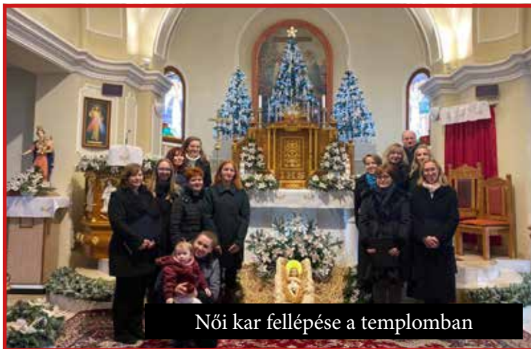
Női kar fellépése a templomban