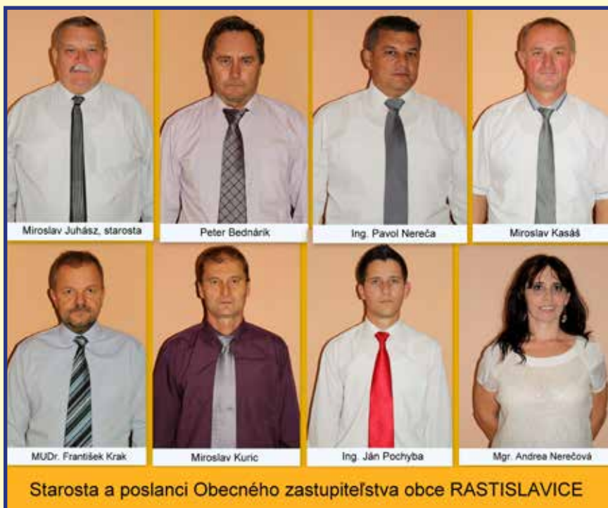
Starosta a poslanci Obecného zastupiteľstva obce RASTISLAVICE