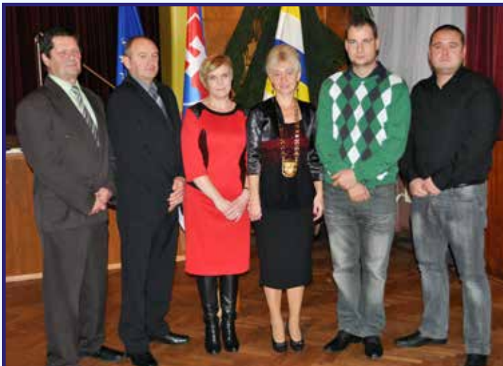
Poslanci obce a starostka

v ňom množstvo informácií o našej obci a jej aktivitách.“ Vychádzame v čase pred sviatkami zosnulých, preto mi neďá nespomenúť Dom smútku s príslušným priestranstvom je pravidelne upravovaný a kosený. Zatiaľ prešiel iba čiastočnou úpravou, potrebuje ešte doplnkové vybavenie, na ktoré