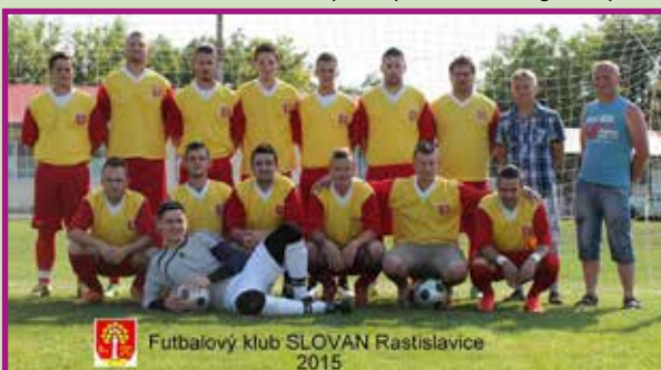
Futbalový klub SLOVAN Rastislavice 2015

Vedenie obce podporuje kultúrno – spoločenský život a plánuje koncom roka podnieť založenie pobočky Jednoty dôchodcov Slovenska.