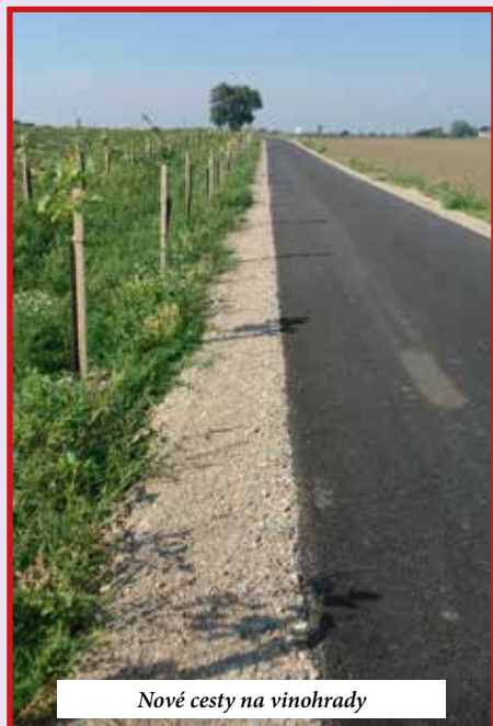
Nové cesty na vinohrady

- V podstate separujeme všetko, od papiera, kovov, umelých fliaš až po sklo, tetrapaky, polystyrén, baterky, elektroodpad... Potrebujeme, aby sa ľudia viac zapájali do separovania odpadu. Separovaním sa šetrí a najmä chráni životné prostredie. Sú to druhotné suroviny a tie sa ešte môžu na niečo iné využiť. Zamezujeme tým aj vzniku divokých skládok. Čo si možno ľudia neuvedomujú, je, že separovaný zber ako taký máme zadarmo. Komunálny odpad však platíme od tony. Navyše ak ľudia dajú do kontajnera aj stavebný odpad, cena za jeho odvoz vybehne veľmi vysoko a v neposlednom rade si to aj tak zaplatí občan. Zo štatistik vyplýva, že veľmi málo ľudí separuje. Pokiaľ ide o množstvo a váhu, naša obec prispieva približne 10 %-mi separovaním. Nikto neseparuje napr. kelímky od jogurtov, plechovky od nápojov a ďalšie umelé obaly, ale aj takéto maličkosti sa separujú. Ďalším problémom je, že mnohí občania nemajú kompostovisko. Ak by odpad, ktorý majú, kompostovali, zasa by sme niečo ušetrili. Celá spoločnosť na tom prerába. V separovaní pneumatík nastali zmeny v tom, že pneumatiky sa v obci nezberajú ani neseparujú (zber je spolplatený). V zmysle zákona o odpadoch je povinnosťou výrobcu, predajcu či pneuservisu