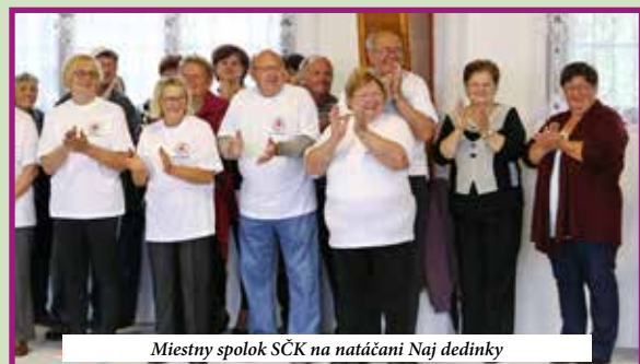
Miestny spolok SČK na natáčaní Naj dedinky

Najmladšou organizáciou je Klub mladých Rastislavice, ale činnosťou sa od začiatku radí medzi tie najaktívnejšie. Mladí ľudia sa zapájajú do všetkých oblastí života obce. Zúčastňujú sa brigád, akcií organizovaných obcou a sami organizujú športové, kultúrne a vzdelávacie podujatia. V obci okrem týchto spolkov pracuje aj poľovnícke združenie, spolok cvičencov a krúžok Ručičkovo. Veľmi aktívni sú aj evanjelici, ktorí organizujú zaujímavé stretnutia.