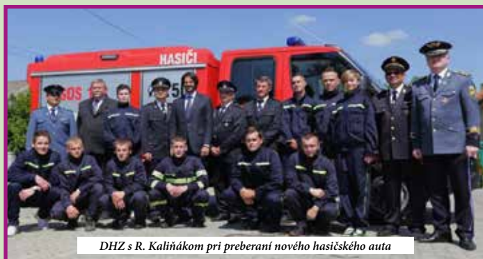
DHZ s R. Kaliňákom pri preberaní nového hasičského auta

Súčasťou kultúrne – spoločenského života v obci záujmové organizácie, činnosť ktorých prispieva k vytváraniu všestranných príležitostí na uspokojenie občanov. Obec Rastislavice je síce malá dedina, ale s veľkým počtom ľudí, ktorí sa aktívne zapájajú do života obce.