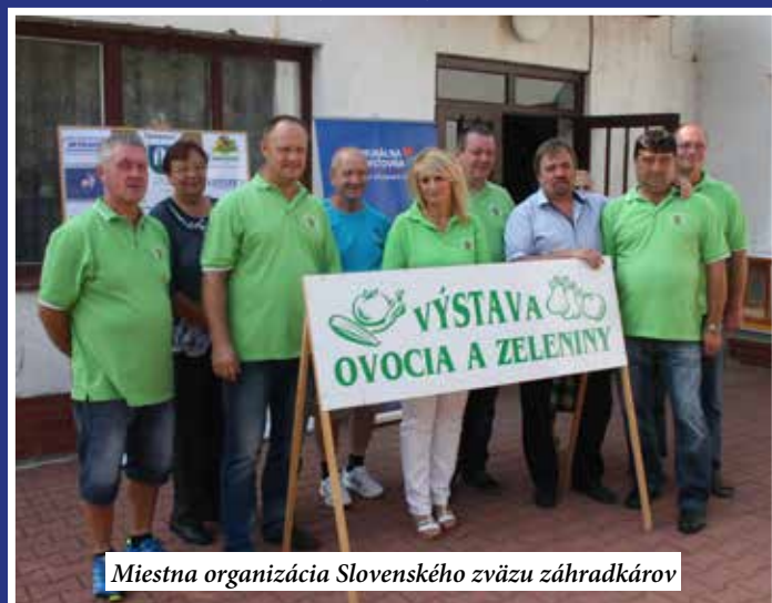
Miestna organizácia Slovenského zväzu záhradkárov