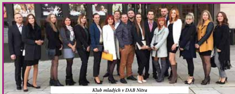
Klub mladých v DAB Nitra