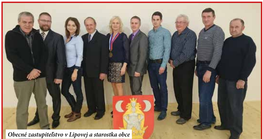
Obecné zastupiteľstvo v Lipovej a starostka obce

- Park „Šťastná rodina“ je veľmi kreatívny v tom, že sa nachádza na vynikajúcom mieste - pri škôlke a pred kostolom. Sú tam pekné drevorezby - tú, ktorá symbolizuje park, tvoria bociany, lipový list, štvorlístok pre šťastie, a charakterizuje symbol rodiny ako hlavného článku celej našej lipovskej komunity. Okrem hlavnej drevorezby sú v parku vyrezané zaujímavé lavičky v tvare zvieratiek a rozprávkových bytostí. Hlavný účel tohto parku je stretávať sa, komunikovať a tráviť tu pekné chvíle so svojimi blízkymi, priateľmi, spoluobčanmi. Jeho otvorenie bude trochu netradične v zimnom období, kedy pre deti každoročne