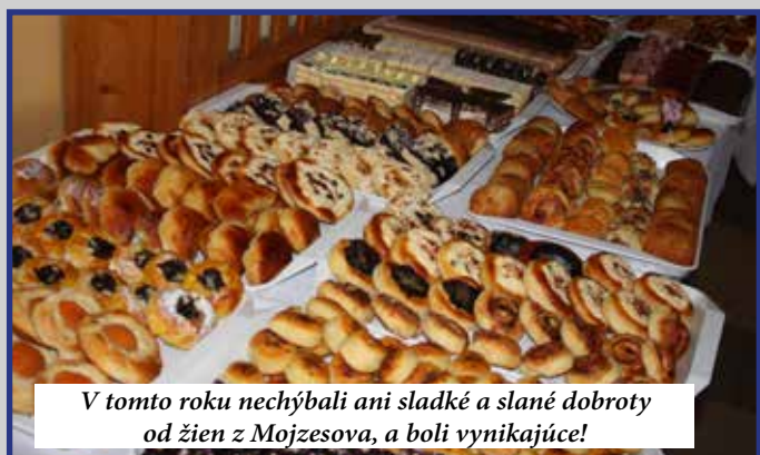
V tomto roku nechýbali ani sladké a slané dobroty od žien z Mojzesova, a boli vynikajúce!