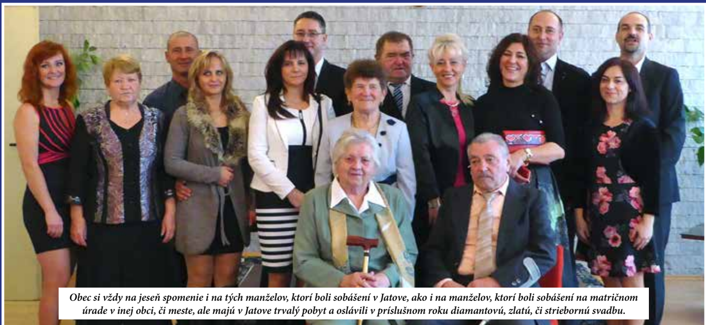
Obec si vždy na jeseň spomenie i na tých manželov, ktorí boli sobášení v Jatove, ako i na manželov, ktorí boli sobášení na matričnom úrade v inej obci, či meste, ale majú v Jatove trvalý pobyt a oslávili v príslušnom roku diamantovú, zlatú, či striebornú svadbu.

Každoročne balíčky pre naše deti venujú sponzori, ktorým sa chceme i touto cestou veľmi pekne poďakovať. V závere roka som sa prihovarila občanom a popriala im k vianočným sviatkom mnoho zdravia, síl a odhodlania do nového roka. Mojim práním je, aby sme v budúcom roku pokračovali v aktivitách, ktoré máme za cieľ – zveľaďovať obec v prospech všetkých občanov. Ak budeme úspešní a splní sa nám, čo sme si naplánovali a predsavzali,