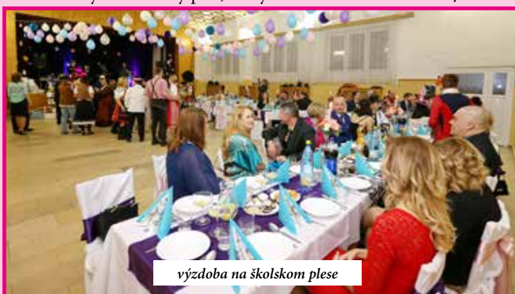
výzdoba na školskom plesu

sa konal 28. januára 2017, bol už jedenástym plesom v organizovaní spoločenských udalostí tejto spoločnosti. Tento ples sa stal pre ľudí, ktorí ho pravidelne poctia svojou účasťou, neoddeliteľnou súčasťou spoločenského diania. Vstupenky majú organizátori každoročne vypredané niekoľko týždňov dopredu. Členovia poľníckej spoločnosti sa aktívne zapájajú do celkových príprav na túto udalosť a nedovolia si v žiadnom prípade „podliezť nastavenú latku“. Pre hostí je vždy pripravené fantastické menu z diviny, kvalitné víno a „popolnočný“ guláš. Poľnú atmosféru dotvára výzdoba sály k tejto téme, organizátori sú odetí v zelených „poľníckych“ oblekoch. A tak tomu bolo aj tento rok. K výbornej zábave dopomohla hudobná skupina AZ Štýl zo Šurian, samozrejme nechýbala tombola. Kultúrny dom v Mojzesove „praskal vo švíkoch“ a organizátori sa už teraz tešia na dvanásť ročník!