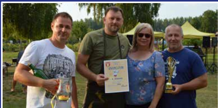
Vítaz je len jeden