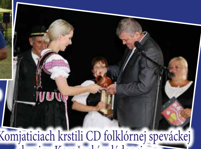
V Komjaticiach krstili CD folklórnej speváckej skupiny Komňackí mládenci /str.6