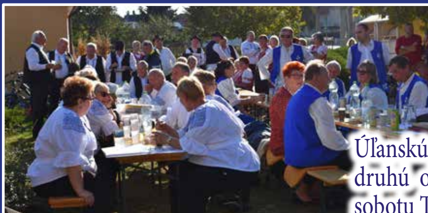
Úľanskú jeseň spestrili druhú októbrovú sobotu Tekvicové slávnosti /str.23