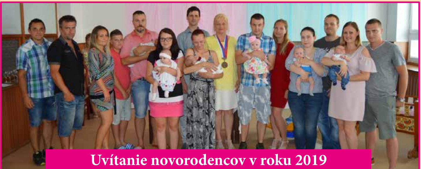
Uvítanie novorodencov v roku 2019