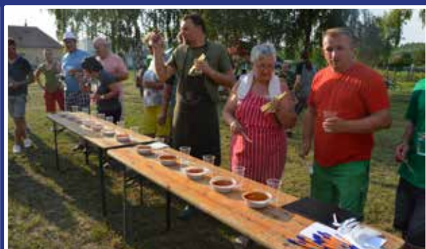
Ktorý chutí najlepšie?