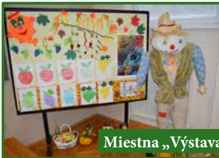
Miestna „Výstava ovocia, zeleniny, kvetov 2019“