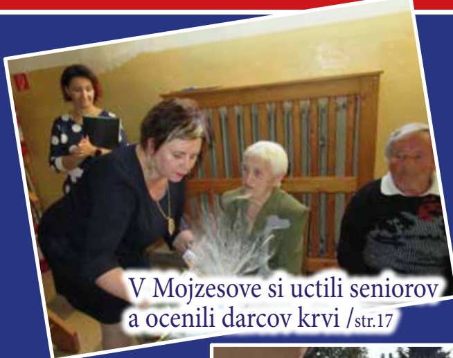
V Mojzesove si uctili seniorov a ocenili darcov krvi /str.17

ROČNÍK IV. OKTÓBER 2019 Časopis občanov, obcí, inštitúcií a firiem okresu Nové Zámky