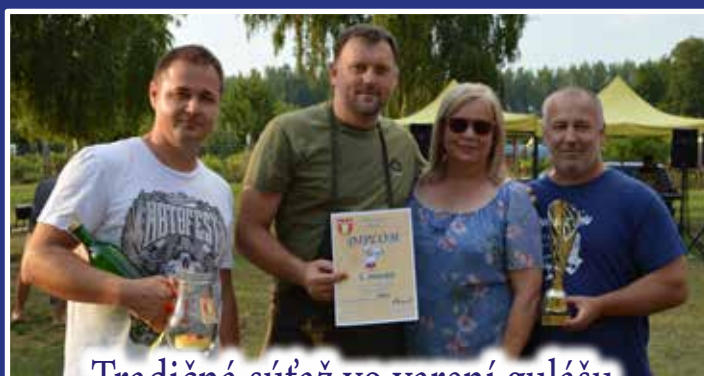
Tradičná súťaž vo varení gulášu v Ondrochove dopadla výborne /str.10