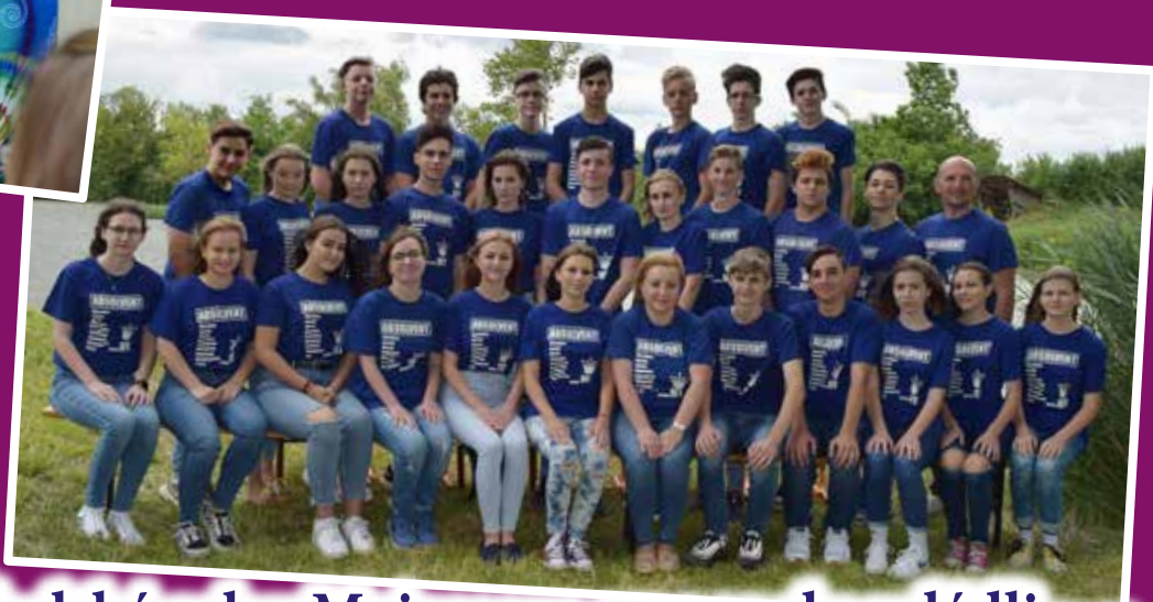
Školský rok v Mojzesove sme spolu zvládli /str.14