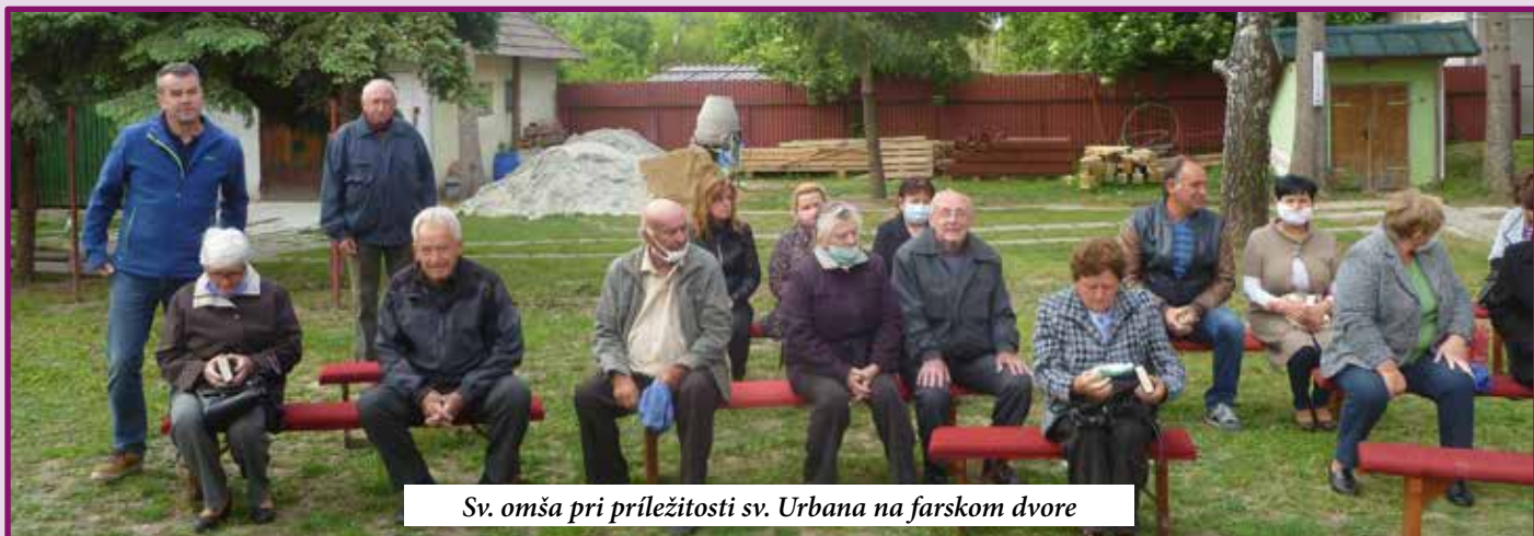
Sv. omša pri príležitosti sv. Urbana na farskom dvore