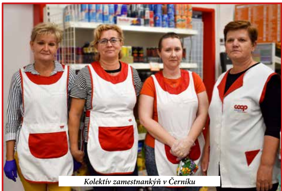
Kolektív zamestnankýň v Černíku

Kým médiá často vyzdvihovali prácu zdravotníkov, lekárov, záchranárov, hasičov, policajtov či vojakov, aj predavačky boli v prvej línii takisto najviac ohrozené, pretože museli dennodenne zvládať nápor veľkého množstva zákazníkov v predajniach. Kým tí si chceli čo najrýchlejšie nakúpiť a uchýliť sa do pohodlia svojho domova, ony museli aj v tejto