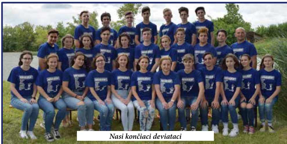
Nasi končiaci deviatiaci