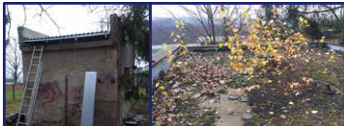
Rozprávková premena vodárne

Pokračovali sme aj v rekonštrukcii interiéru a exteriéru školy. V týchto dňoch začína rekonštrukcia elektroinštalácie prízemí v II. pavilóne. Obkladom stien získalo nový