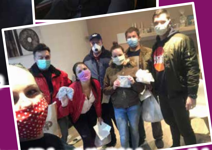
Obnovený Dobrovoľný hasičský zbor vypomáhal v Úľanoch nad Žitavou počas pandémie /str.24