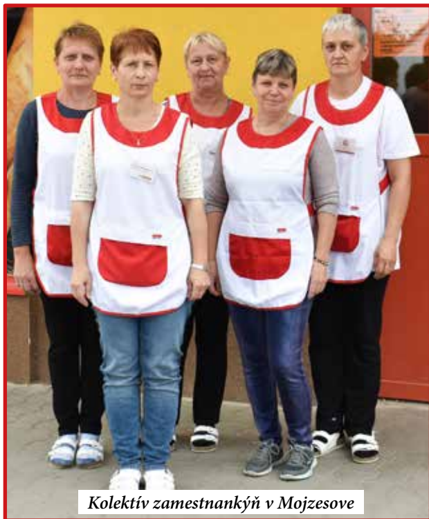
Kolektív zamestnankýň v Mojzesove