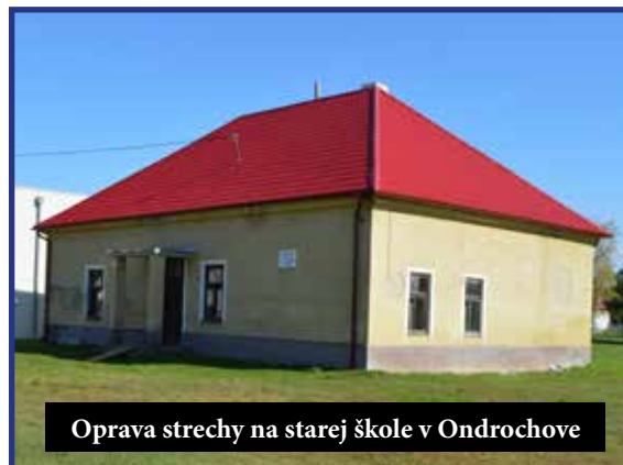
Oprava strechy na starej škole v Ondrochove