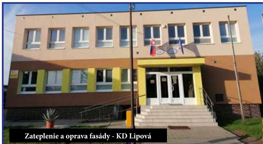
Zateplenie a oprava fasády - KD Lipová