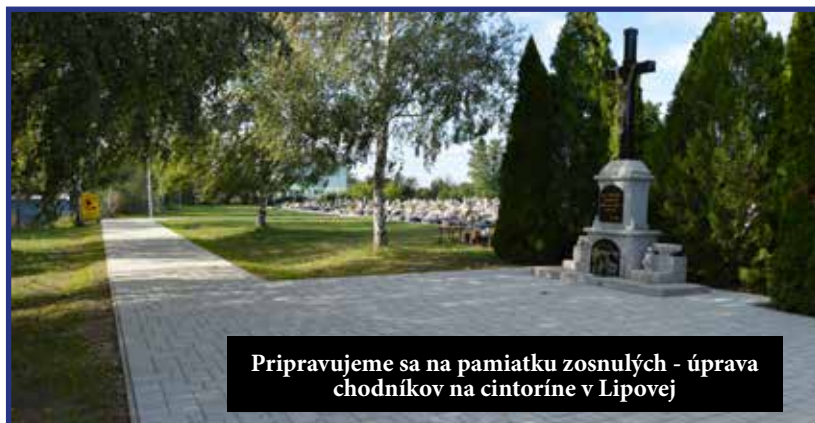
Pripravujeme sa na pamiatku zosnulých - úprava chodníkov na cintoríne v Lipovej