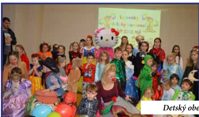
Detský obecný karneval