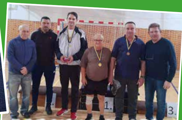
Trojkráľový stolnotenisový turnaj v Dolnom Ohaji sa teší hojnej účasti súťažiacich /str.20

Občianske združenie Lotta v Šuranoch pomáha kastráciou skvalitniť život mačiek, čím súčasne zabraňuje šíreniu infekčných chorôb.