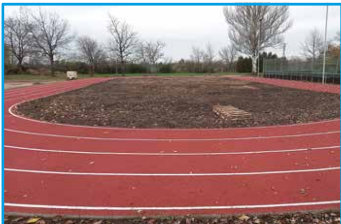
Revitalizácia atletickej dráhy v ZŠ s MŠ Bánov