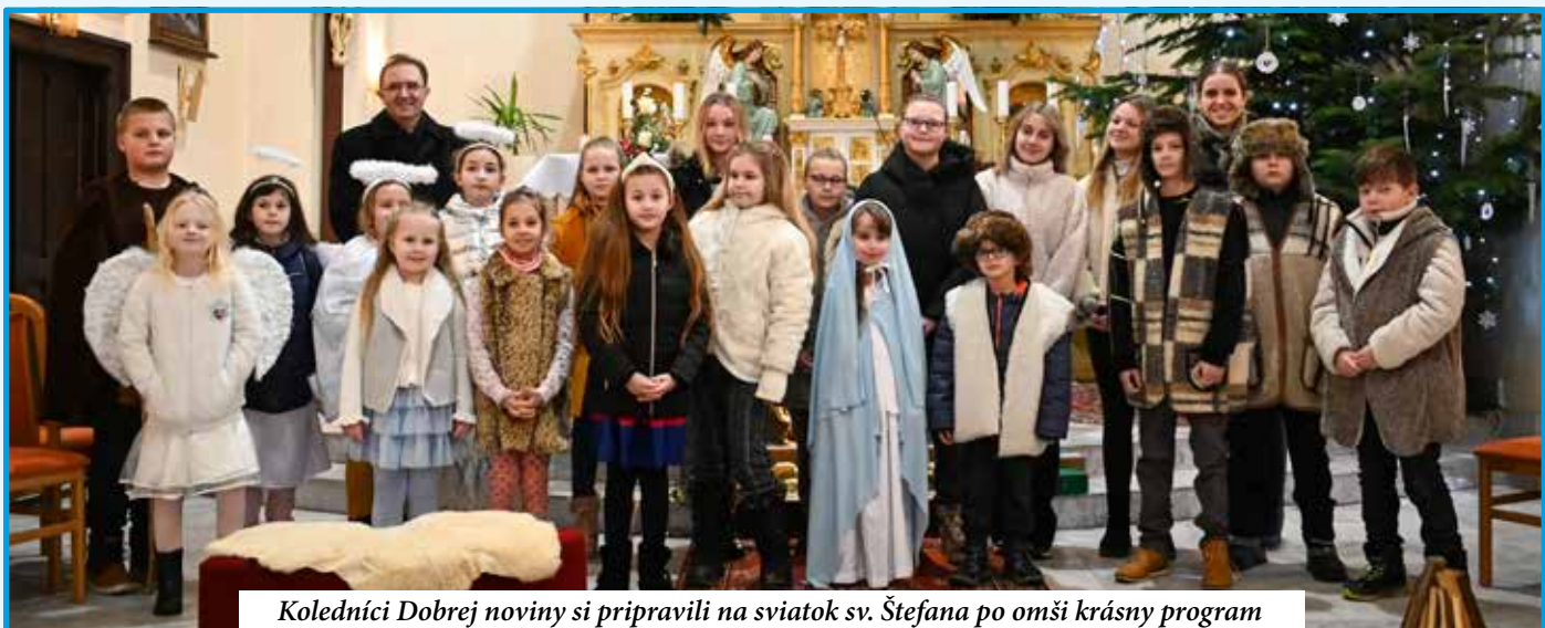
Koledníci Dobrej noviny si pripravili na sviatok sv. Štefana po omši krásny program

Už roky panuje v Úľanoch pekný zvyk zapalovať na uliciach vatru, okolo ktorej sa zídu všetci z okolitých domov, aby si pred zazvonením na Štedrú večeru popriali krásne sviatky. Susedské vzťahy sa utužia pri vianočnom pečive či poháriku vareného vínka alebo punču. Malé deti sa najviac tešia z ohňostrojov, ktoré utichnu odbitím sedemnásťtej hodiny, kedy sa všetci spoločne rozídu do svojich príbytkov na Štedrú večeru.