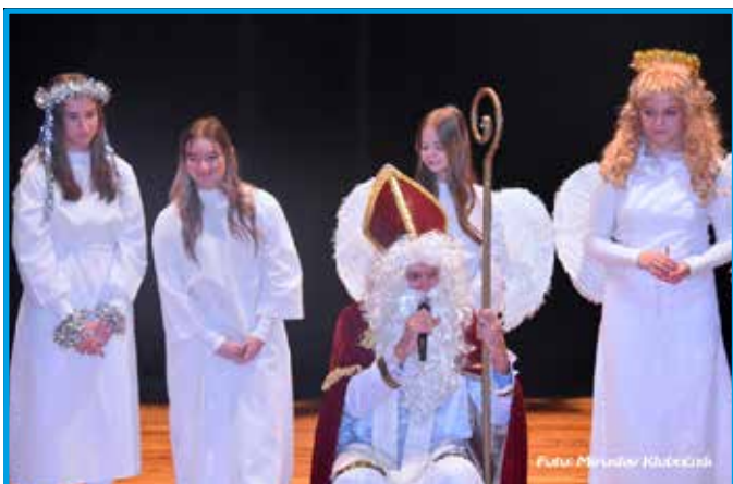
Stretnutie s Mikulášom