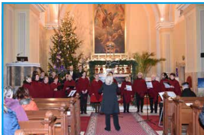
Predvianočný koncert v kostole