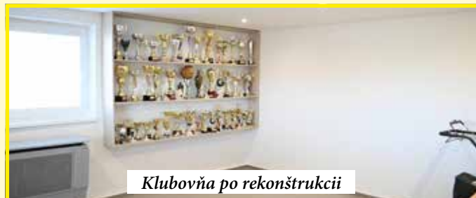
Klubovňa po rekonštrukcii