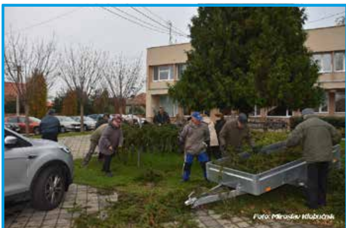
Adventný veniec - viazanie čičiny