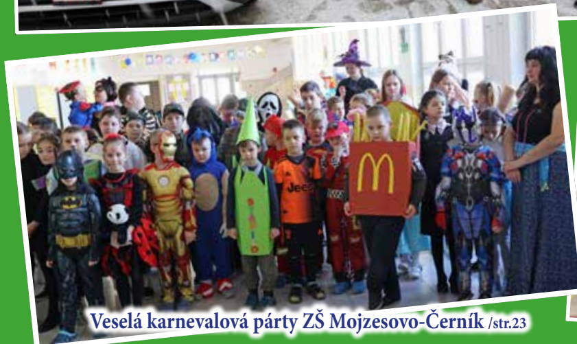
Veselá karnevalová párty ZŠ Mojzesovo-Černík /str.23