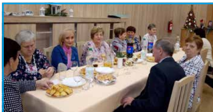
...na plese Základnej organizácie Jednoty dôchodcov Slovenska Dolný Ohaj 30. decembra 2022