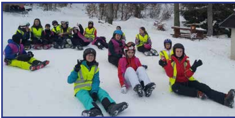
ZŠ Lipová: Lyžovačka v Drozdove...