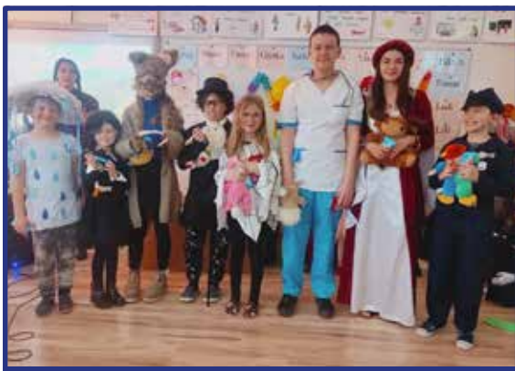
Školský karneval v ZŠ Lipová