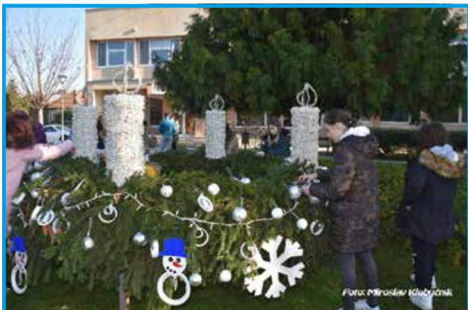
Adventný veniec - zdobenie