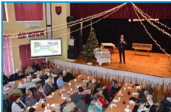
Stretnutie 70- a viacročných občanov