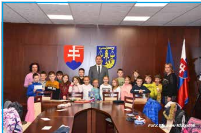
Beseda so starostom