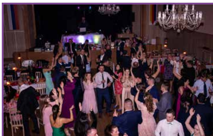
...na Rodičovskom plese 11. februára 2023