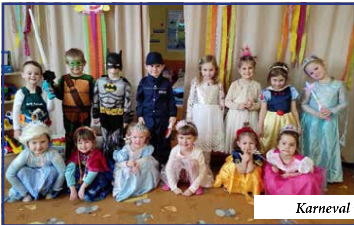
Karneval v MŠ Lipová