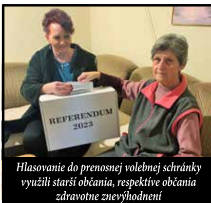
Hlasovanie do prenosnej volebnej schránky využili starší občania, respektíve občania zdravotne znevýhodnení

Prezidentka SR Zuzana Čaputová na základe petície občanov vyhlásila referendum, ktoré sa konalo v sobotu 21. januára 2023 od 7.00 do 22.00 hod. Voliči v referende odpovedali na otázku: „Súhlasíte s tým, že predčasné skončenie volebného obdobia Národnej rady Slovenskej republiky je možné uskutočniť referendum alebo uznesením Národnej rady Slovenskej republiky, a to zmenu Ústavy Slovenskej republiky?“ V Mojzesove prišlo k volebnej urne celkom 419 oprávnených voličov, z čoho platných hlasovacích lístkov bolo 412, tzn. že volebná účasť bola 38,72 %. Počet hlasov ÁNO bolo 410 (37,89 %) a počet hlasov NIE 2 (0,18 %). Keďže sa hlasovania v SR zúčastnilo 1 193 198 osôb, čo predstavuje 27,25 % oprávnených voličov – referendum bolo neplatné.