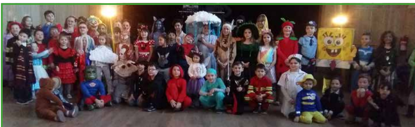
Kultúrny dom sa v nedeľu 5. februára zaplnil tými najrozmanitejšími maskami