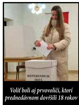
Voliť boli aj prvovoliči, ktorí prednedávnom dovŕšili 18 rokov