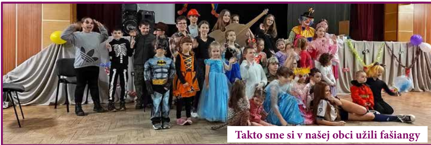
Takto sme si v našej obci užili fašiangy