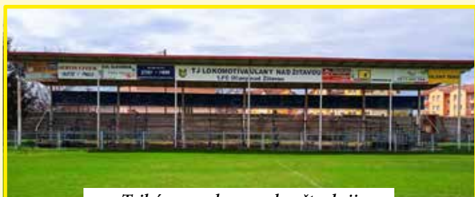
Tribúna pred a po rekonštrukcii

nové stoly, lavice a v každej miestnosti budú osadené nové dvere. Nielen šatne sa však dočkali vymoivenia. Už v lete minulého roka si starí páni z 1. FC svojpomocne opravili tribúnu, lavice opatрили novým náterom a nainštalovali sa nové sedačky, vďaka čomu má teraz tribúna konečne reprezentatívny vzhľad. Na ihrisku takisto pribudli dve nové striedačky a na bufete a sociálnych zariadeniach sa osadili nové dvere. Okrem dotácie zo SFZ im na rekonštrukčné práce prispel aj Obecný úrad Úľany nad Žitavou. Veľké poďakovanie preto patrí obci za poskytnutie finančných prostriedkov, sponzorom a všetkým tým, ktorí akýmkoľvek spôsobom pomohli pri rekonštrukcii, najmä hráčom, funkcionárom a priaznivcom, čím prispeli k ďalšiemu rozvoju športovej kultúry našich občanov, detí a mládeže.