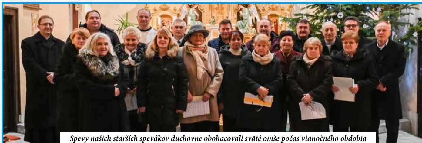
Spevy našich starších spevákov duchovne obohacovali sväté omše počas vianočného obdobia